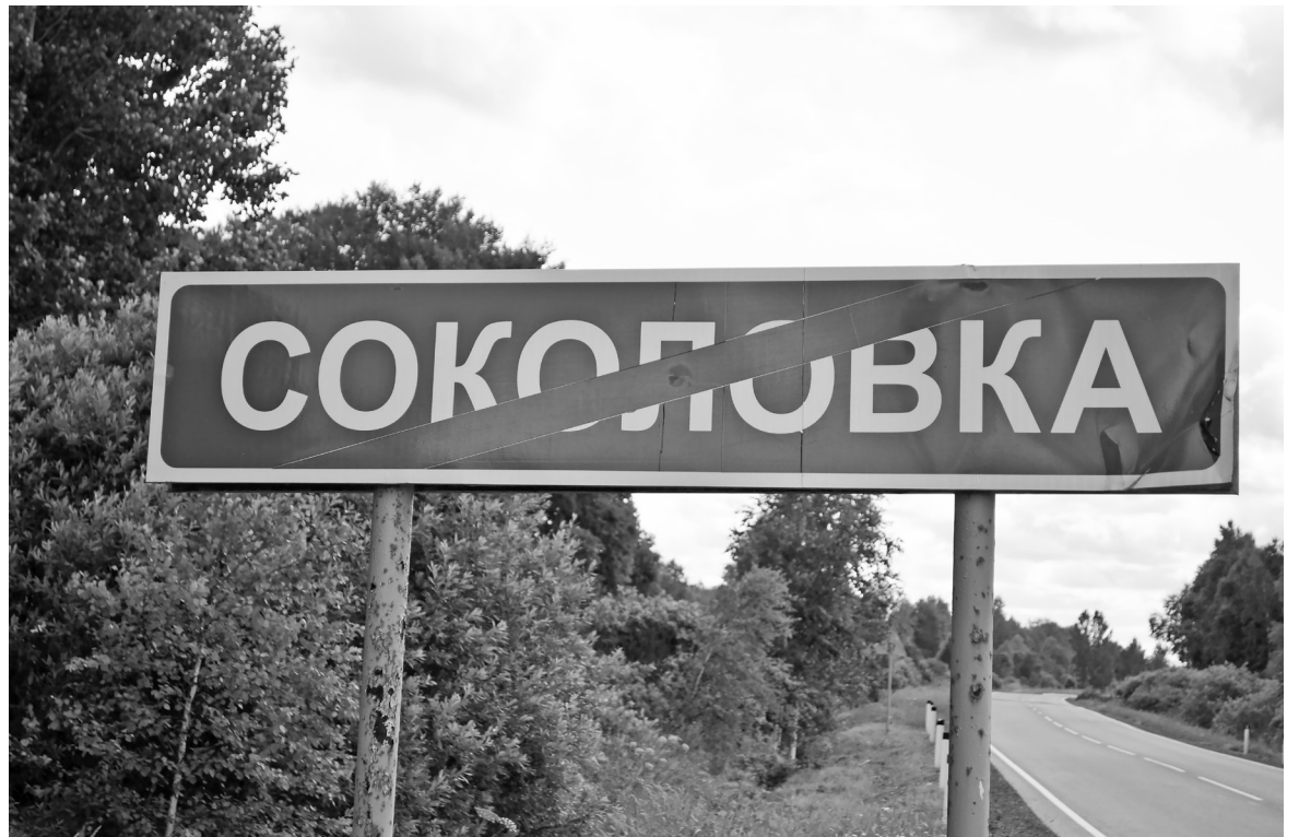
В большинстве малых населённых пунктов остались одни старики. Но это не значит, что можно о них забыть. Разве нашей задачей не является забота о том, чтобы их старость была достойной?

Да, как работник торговли я могу понять этот момент, но здесь же люди живут, большинство из которых уже преклон-