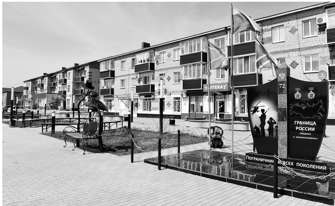
Сквер Пограничников в селе Бердюжье Тюменской области

Я вызвал дневального Толю Тагильцева, мы получили все необходимое и прибыли в штаб. На площадке для инструктажа нас построили, майор из особого отдела зачитал приказ. Суть приказа была такова: с места заключения сбежали двое азиатского происхождения арестантов. Они тяжело ранили охранника, завладели его оружием, захватили автомобиль ГАЗ-69. По оперативным данным вооруженные беглецы двигаются в сторону китайской границы. Наша задача: перекрыть все дороги в поселок и объездные проселочные, ведущие к границе. Порядок действия: 1. Занять оборону в придорожных кюветах и вести наблюдение. 2.