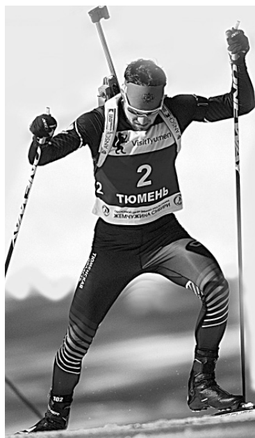
Биатлонисты Тюменской области всегда достойно выступают на соревнованиях