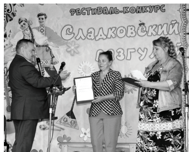
Моменты праздничного мероприятия.