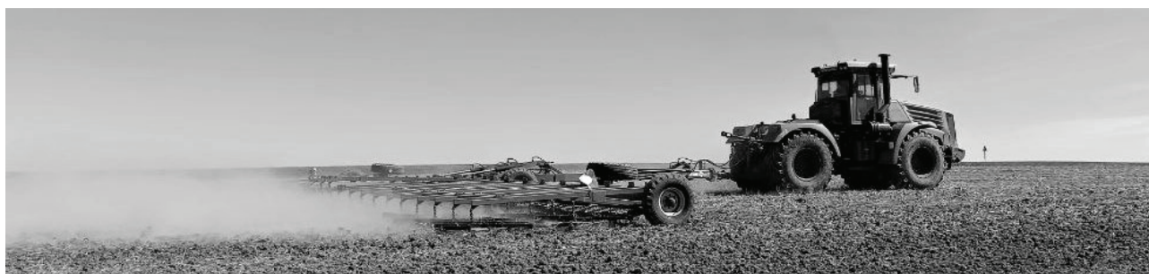
Специалисты СПК «Таволжан» начали горячий сезон.

К полевым работам труженики предприятия приступили первыми в нашем районе – 21 апреля.