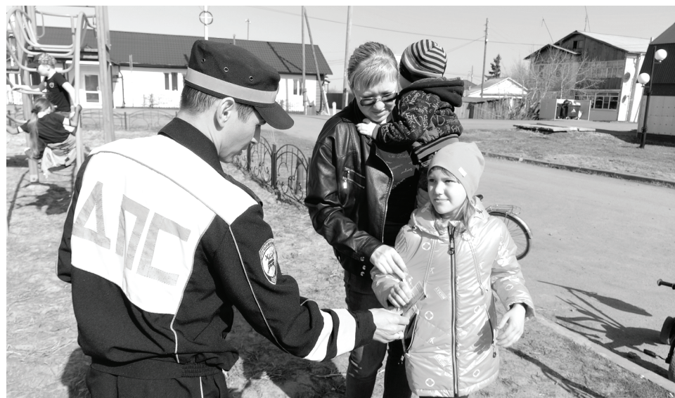
Сладковцам раздали памятки и листовки, а также закладки для учебников, где говорится об основных условиях безопасного движения.