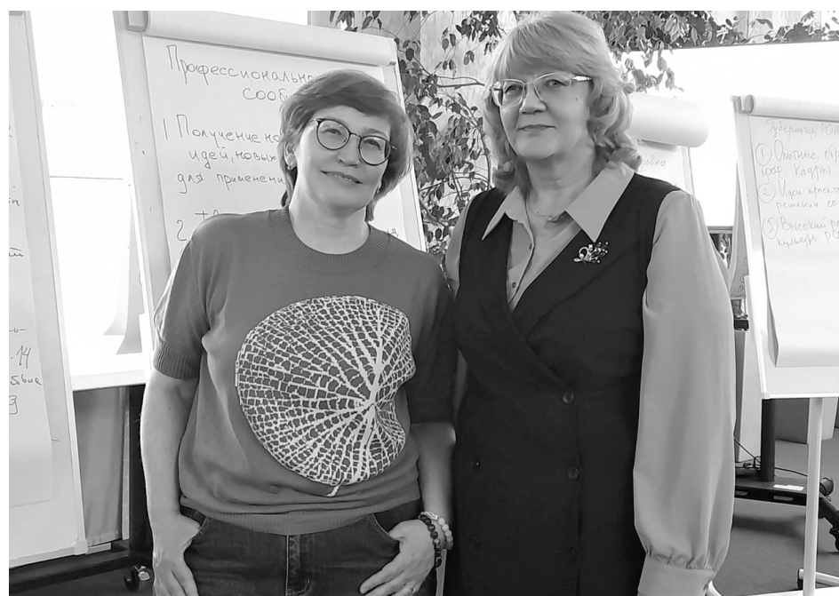
Мы ищем новые подходы.

В Тюменской областной научной библиотеке им. Д.И.Менделеева 17 апреля для библиотекарей региона проходил отраслевой день #КОФТО24 — «Знания для жизни», в котором приняли участие более 80 сотрудников библиотек из 25 муниципалитетов области, в том числе из Сладковского района.