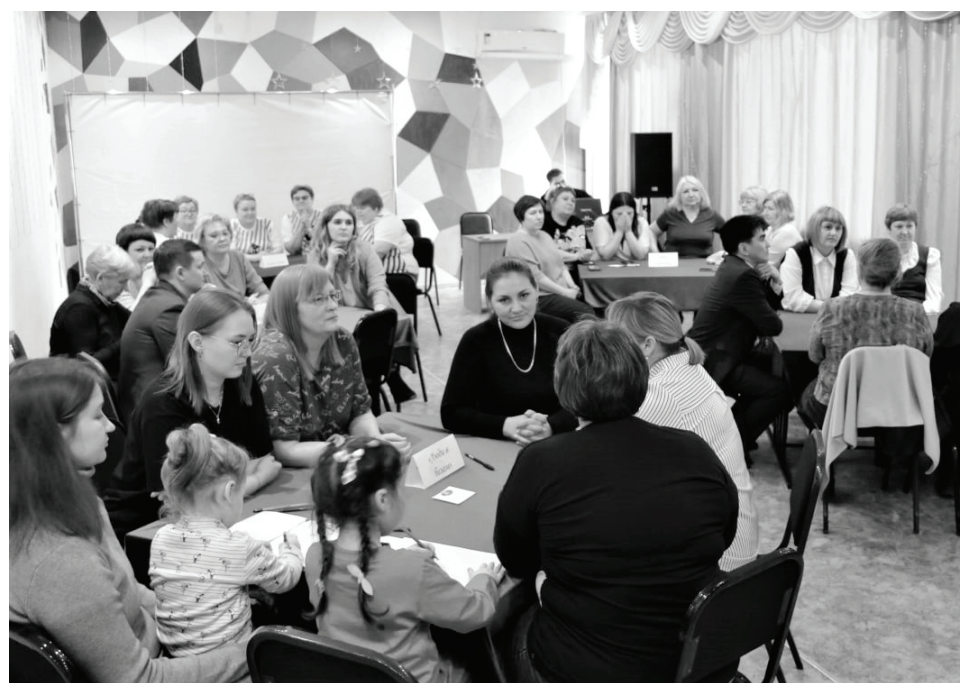
На размышление — минута.

В турнире приняли участие пять команд, состоящих из шести человек: детско-юношеской спортивной школы «Темп», Сладковской средней школы «Мудрая сова», Усовской средней школы «Семь пядей», районной библиотеки «PRO-читайка» и «Люди в белом» — Сладковской районной больницы.