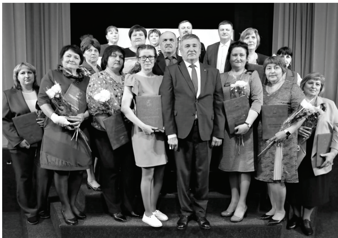
Благодаря вкладу муниципальных служащих Россия шагает в ногу со временем по всем направлениям.

– Местное самоуправление – основа любого демократического общества. Оно является самой приближённой к людям формой власти и служит важным соединительным звеном между гражданами и государством, – отметил глава территории. – Дорогие коллеги, большой и дружной командой мы выполняем нелёгкую, ответственную миссию – служение жителям района. И от эффективности работы сегодня зависит успешное завтра земляков. Наша главная задача – создание комфортных и достойных условий для проживания,