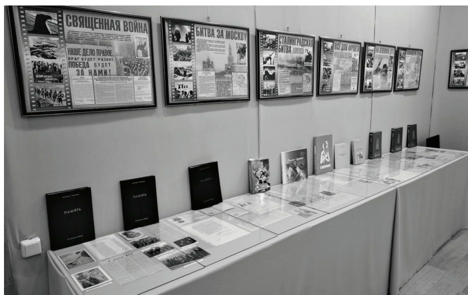
На выставке представлены экспонаты военных лет.