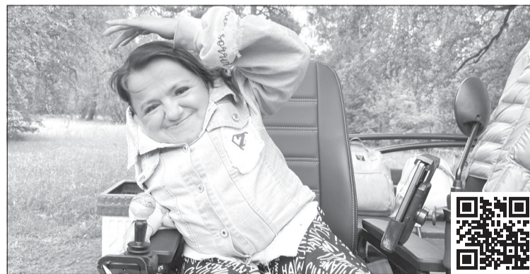
Улыбки, хорошее настроение и повышение общего тонуса организма становятся главной наградой для всех участников занятий

Проект «Фитнес без границ» рассчитан на период с июня по сентябрь: в это время наиболее благоприятные погодные условия для проведения уличных тренировок.