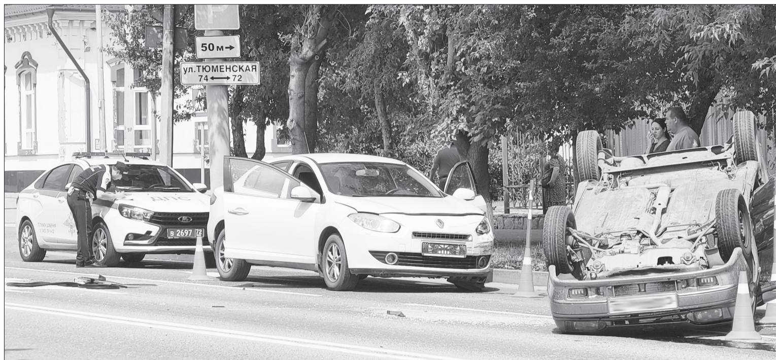
8 июня в районе перекрёстка улиц Ленина и Тюменской за полчаса произошло два ДТП, одно из которых - с опрокидыванием авто на крышу

В Ялуторовске наблюдается сезонный рост аварий