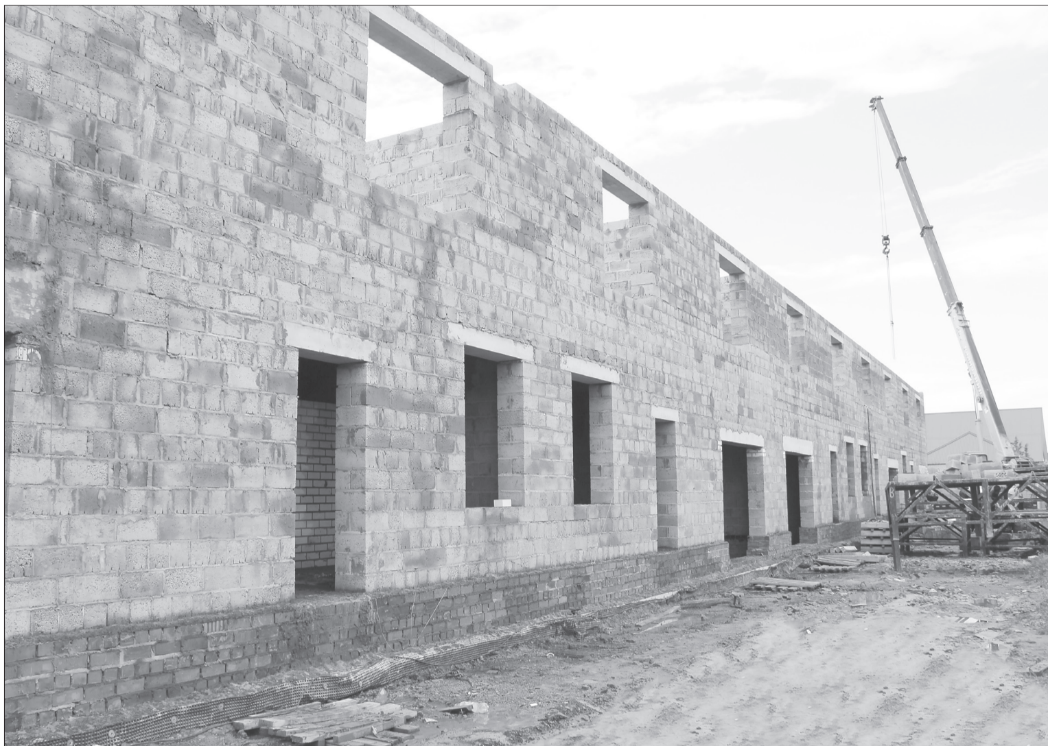
Необычный внешний вид корпуса здания сразу привлёк внимание ялutorовчан

Также на полях продолжается химическая прополка растений, предприятия выполнили её более чем наполовину. Абсолютным рекордсменом обработки всходов от сорняков остаётся ООО «Дружба-Нива», там завершили химпрополку на 80%.