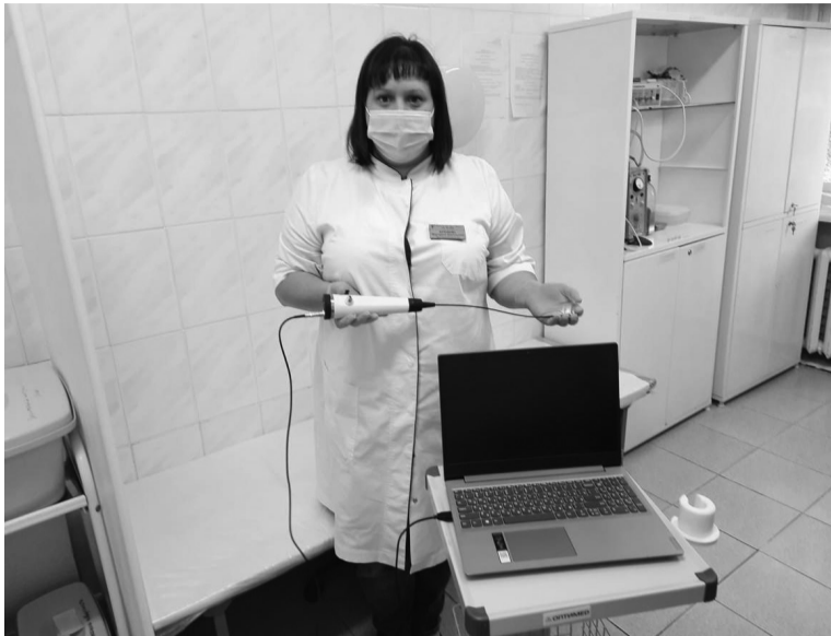
Новое оборудование уже поступило в Викуловскую районную больницу

33 ЕДИНИЦЫ нового оборудования поступили в Областную больницу № 4 г. Ишима в рамках реализации региональной программы модернизации первичного звена здравоохранения.