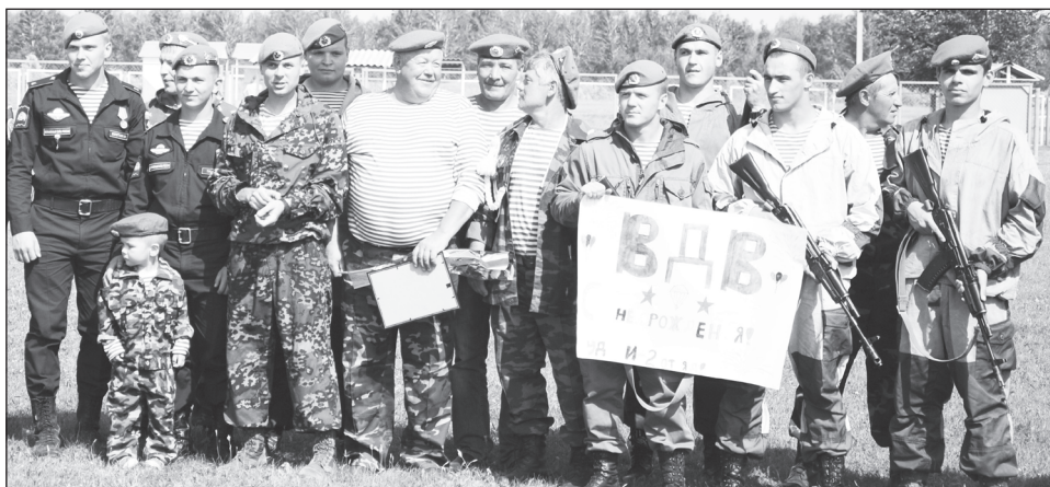
Ребята из лагеря дневного пребывания ДШИ нарисовали поздравительный плакат и подарили его десантникам.