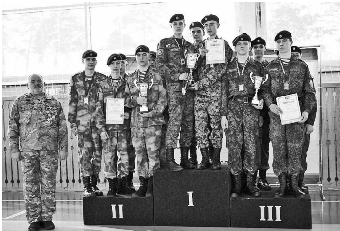
Команды – победители 1 этапа спартакиады допризывной молодёжи в Заводоуковске

В Заводоуковском городском округе состоялся I этап спартакиады среди допризывной молодёжи. Участие в нём приняли юноши от 14 до 17 лет в составе 15 команд из Аромашевского, Викуловского, Вагайского, Ишимского, Казанского, Омутинского, Юргинского, Уватского и Ярковского районов, Голышмановского, Заводоуковского городских округов, а также Ишима, Тобольска, Тюмени и Ялуторовска.