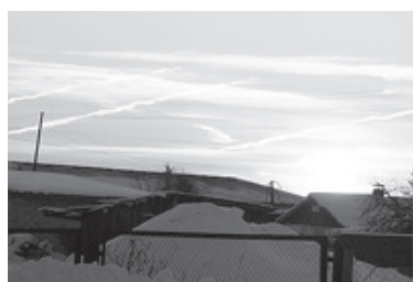
Февральское утро в Сорokino.