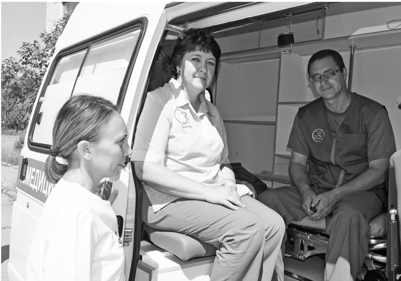
Фельдшеры Велижанской участковой больницы осматривают автомобили скорой помощи, на которых им предстоит работать.