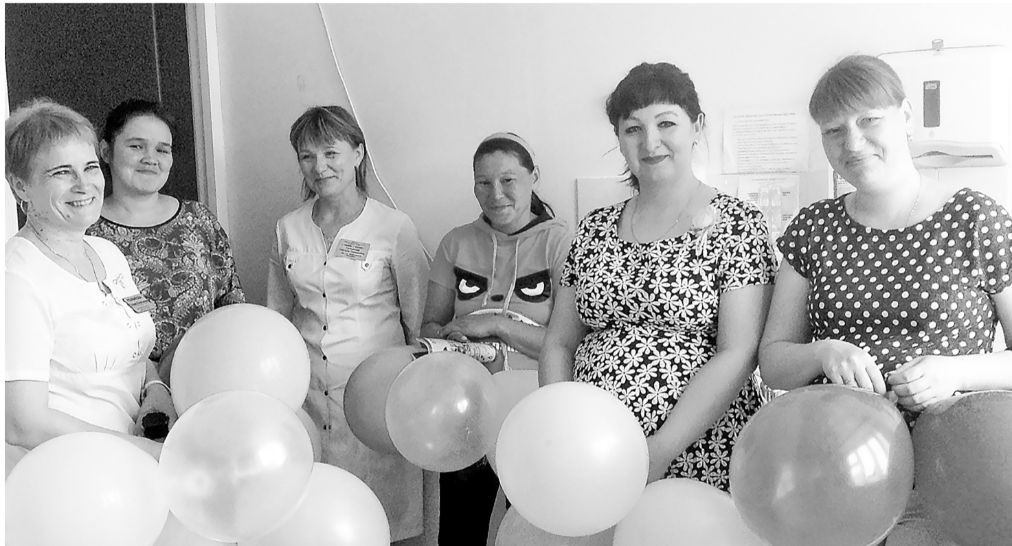
Вот с таким настроением надо готовиться к появлению малыша.