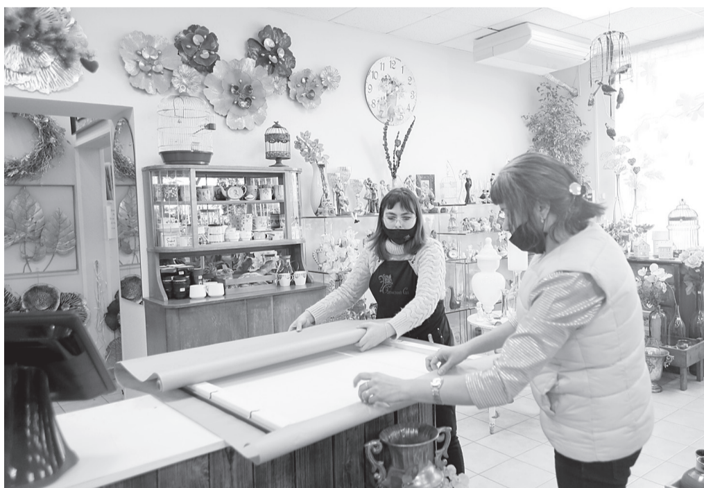
15 лет флористы «Эдема» радуют тоболяков

Вообще тот период одновременно много хорошего и плохого открыл всем нам: и потребителям, и предпринимателям. Мы поняли, как сложно обходиться без элементарных вещей, которые могли запросто купить или сделать в обычное время, но потеряли в пандемию. А предприниматели, находясь на грани выживания своего бизнеса, узнали, способна ли их команда выстоять в экстремальных условиях, готовы ли бороться до конца. Дружная команда «Эдемского сада» доказала, что способна.