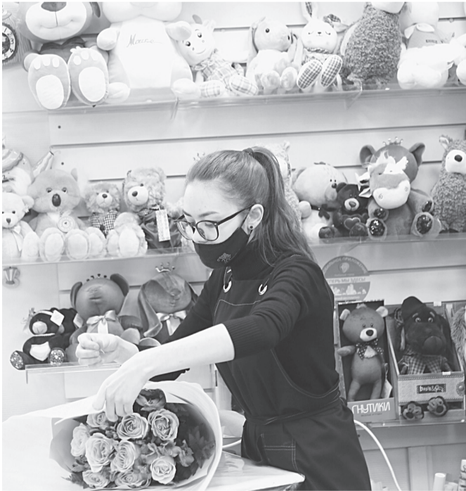
Букеты составляют по заказу клиентов

А потом сложные 90-е, когда строительная от-