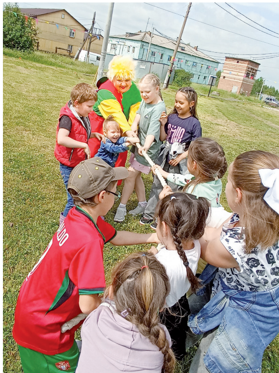
► Сетово. Чья возьмёт?