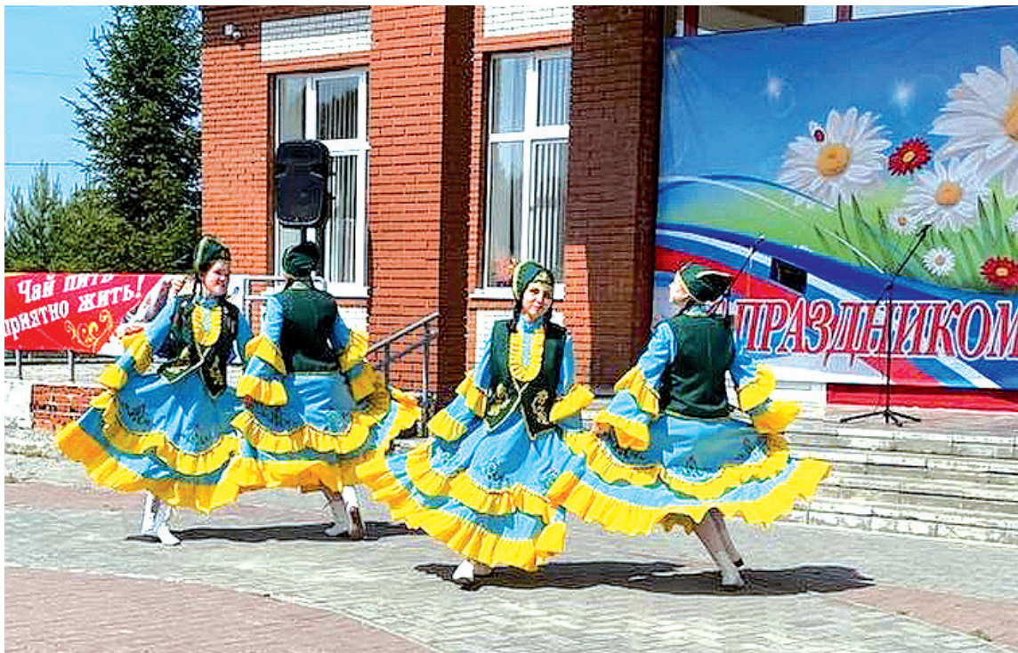
► Байкалово. Юные танцоры раззадорили зрителей

На концертной площадке стало ещё ярче: это ребята из оздоровительного лагеря «Олимпиамик» Байкаловской школы провели зажигательный флешмоб, посвящённый Дню России. Танцы, песни и море улыбок – дети в красно-сине-белых цветах создали настоящее праздничное настроение. Выстроившись в