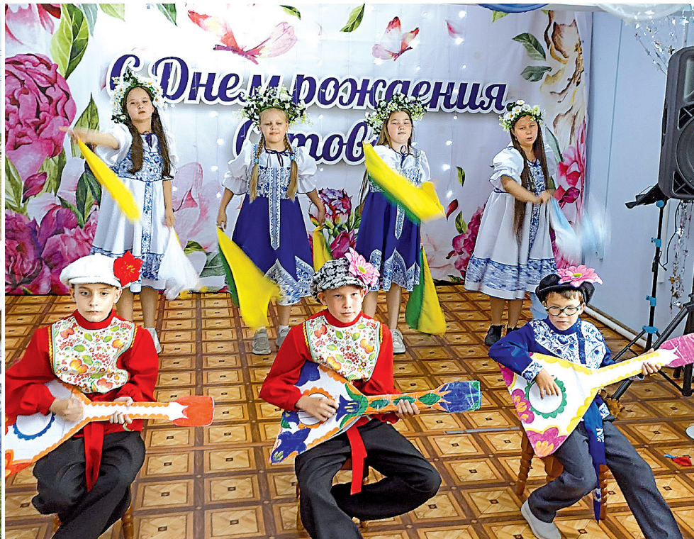
► Любительский коллектив "Капельки" из Ермаковского клуба