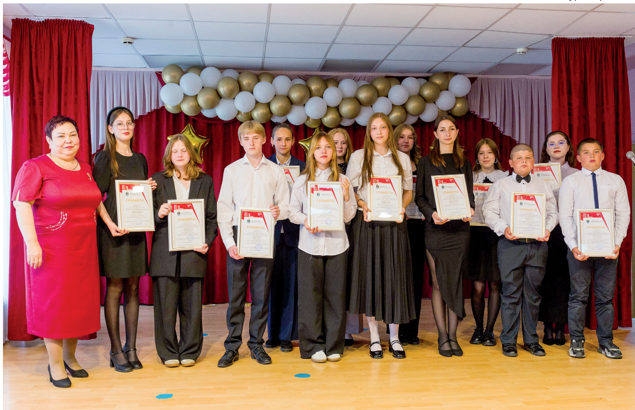
► Победители номинации "Творческая радуга"