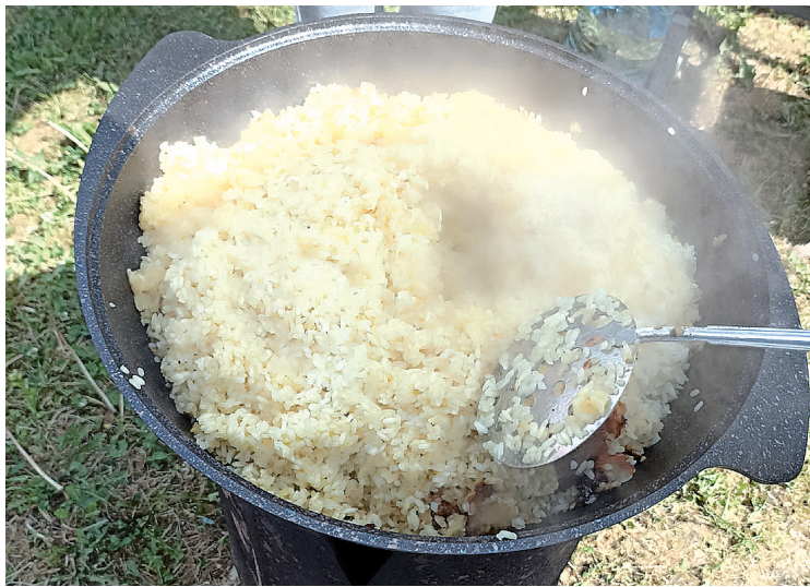
► Отведаете сетовский плов – вкуснятина!

живые флаги и символы России, под ритмичную музыку они продемонстрировали тем самым, как любят свою страну и свой край. И вправду, воспитание юного патриота начинается вот с таких душевных порывов, искренних патриотических моментов.