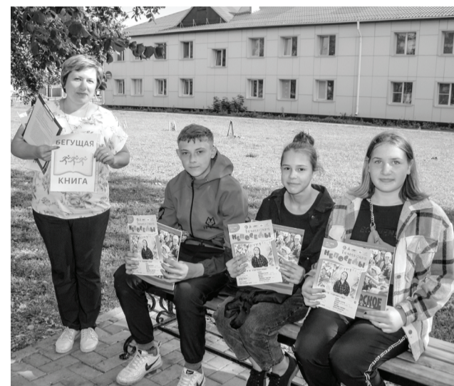
«Бегущая книга» подарила хорошее настроение.