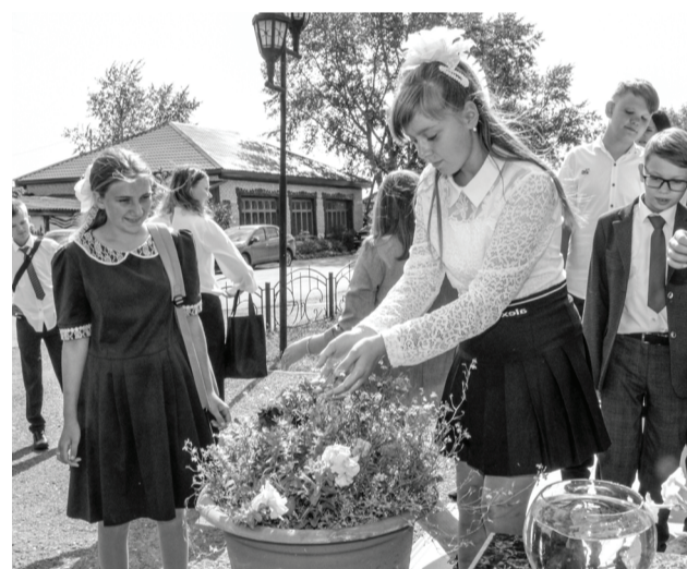
Символическая поливка цветов.

– О событиях, произошедших в Беслане, мы знаем и неоднократно уже о них беседовали. Но каждый раз в очередном