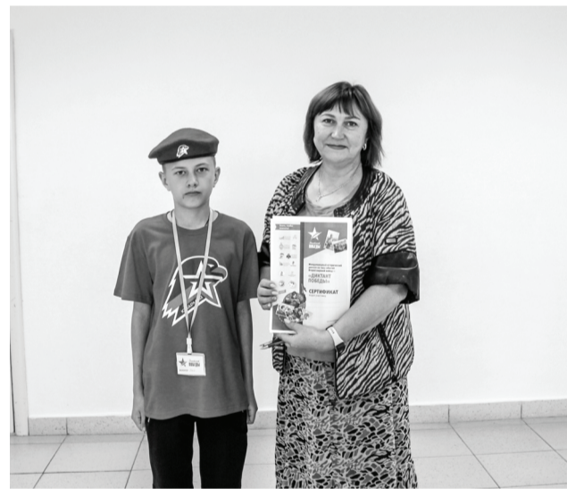
Сладковцы приняли активное участие в акции и получили сертификаты.

Масштабное патристическое мероприятие было приурочено к годовщине окончания Второй мировой войны. Темой его стала Великая Отечественная война.