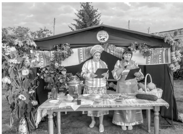
Большое гуляние прошло весело и торжественно.

Посёлок Маслянский отметил 117-й день рождения.