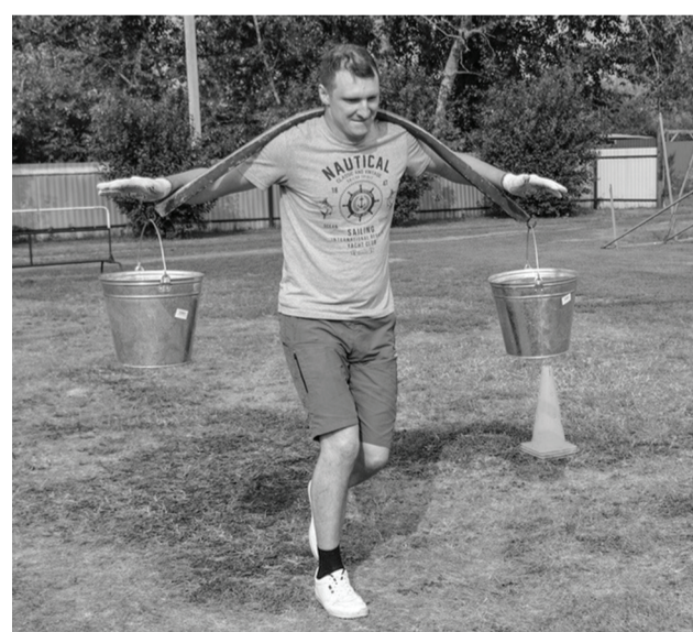
На этапах спартакиады.

– Погода не подкачала, настоящая золотая осень с тёплым солнышком и бодрящим ветерком! Перерыв в спартакиаде