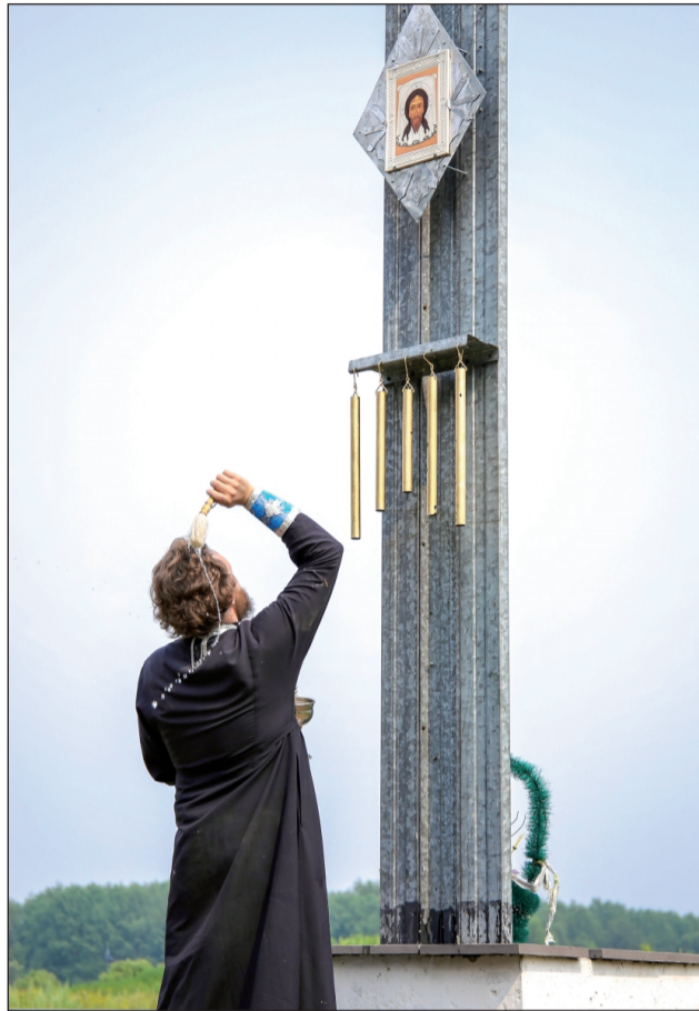
Совершается освящение надвратной иконы Спаса Нерукотворного.

Установленная икона была изготовлена в Санкт-Петербурге по старинной технологии обжига фарфо-