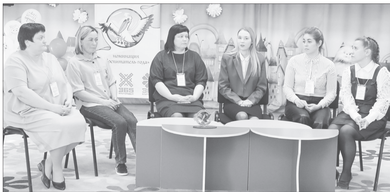
В целом конкурсанты были едины во взглядах на воспитание дошкольников

Испытания для участников конкурса «Педагог года - 2024» завершились