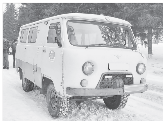
УАЗик принимал лично командир батальона с позывным «Гром»

- Совместно с городской администрацией они нашли добрых людей, которые подарили нам эту машину. Владелец её почил, а родственники решили отдать автомобиль для нужд СВО, - рассказал комбат.