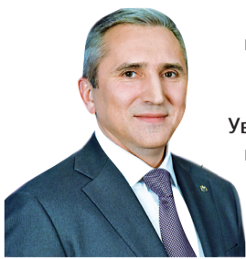
АЛЕКСАНДР МООР губернатор Тюменской области

Уважаемые работники всех отраслей связи Тюменской области! Поздравляю вас с профессиональным праздником – Днём радио! Радио стало одним из первых появившемуся массовым средством информации, для которого нет преграды расстояния и границы. И только потом, благодаря