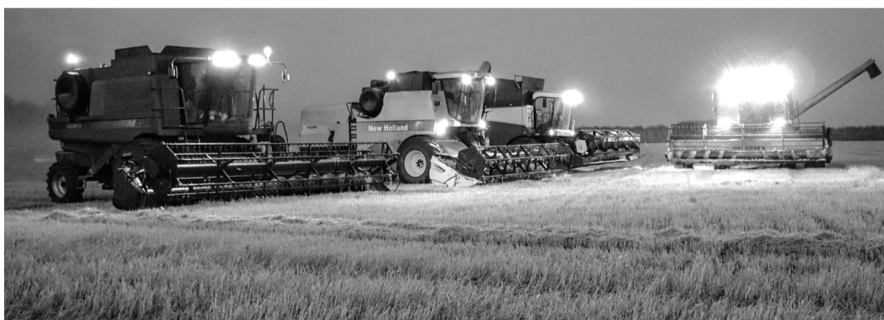
Горячая пора подходит к концу. Сельхозтруженики пожинают плоды своего труда.