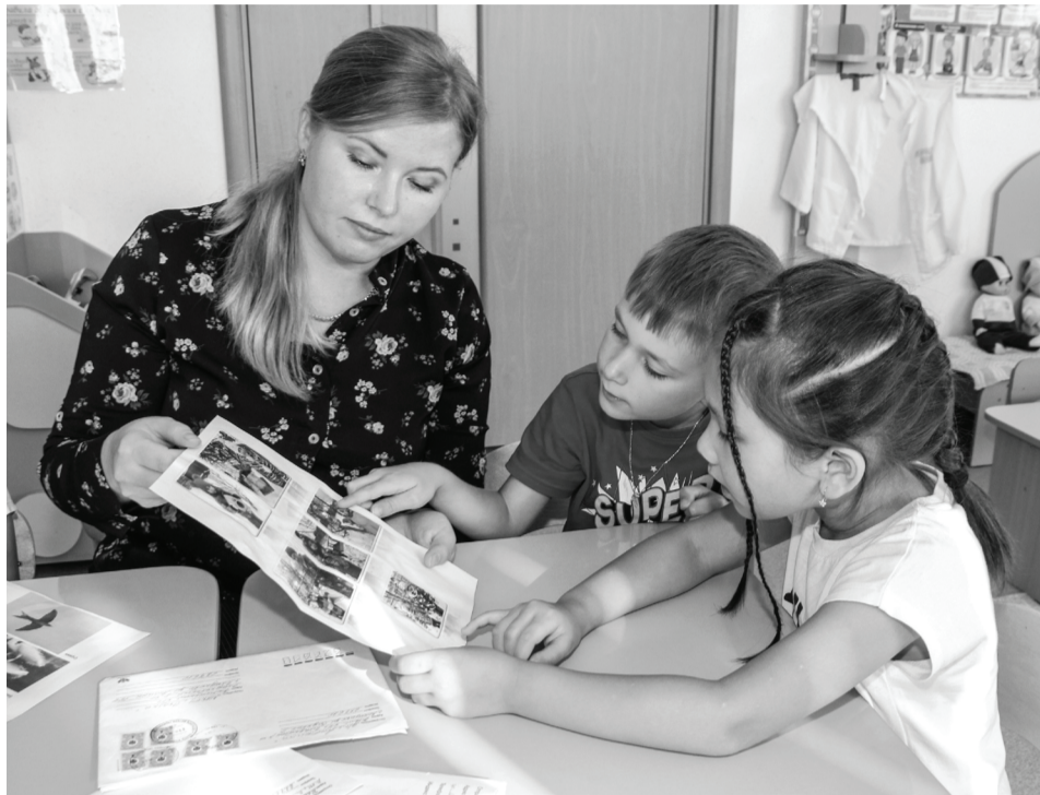
Сладковский педагог реализовывает со своими воспитанниками интересные проекты.

– В первое время я считала, что это самое сложное в нашей работе – найти баланс в отношениях с родителями, коллективом,