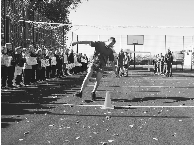
Открытие спортплощадки голышмановцы отметили соревнованиями

Во дворе школы в селе Голышманово появился островок спорта и здорового образа жизни