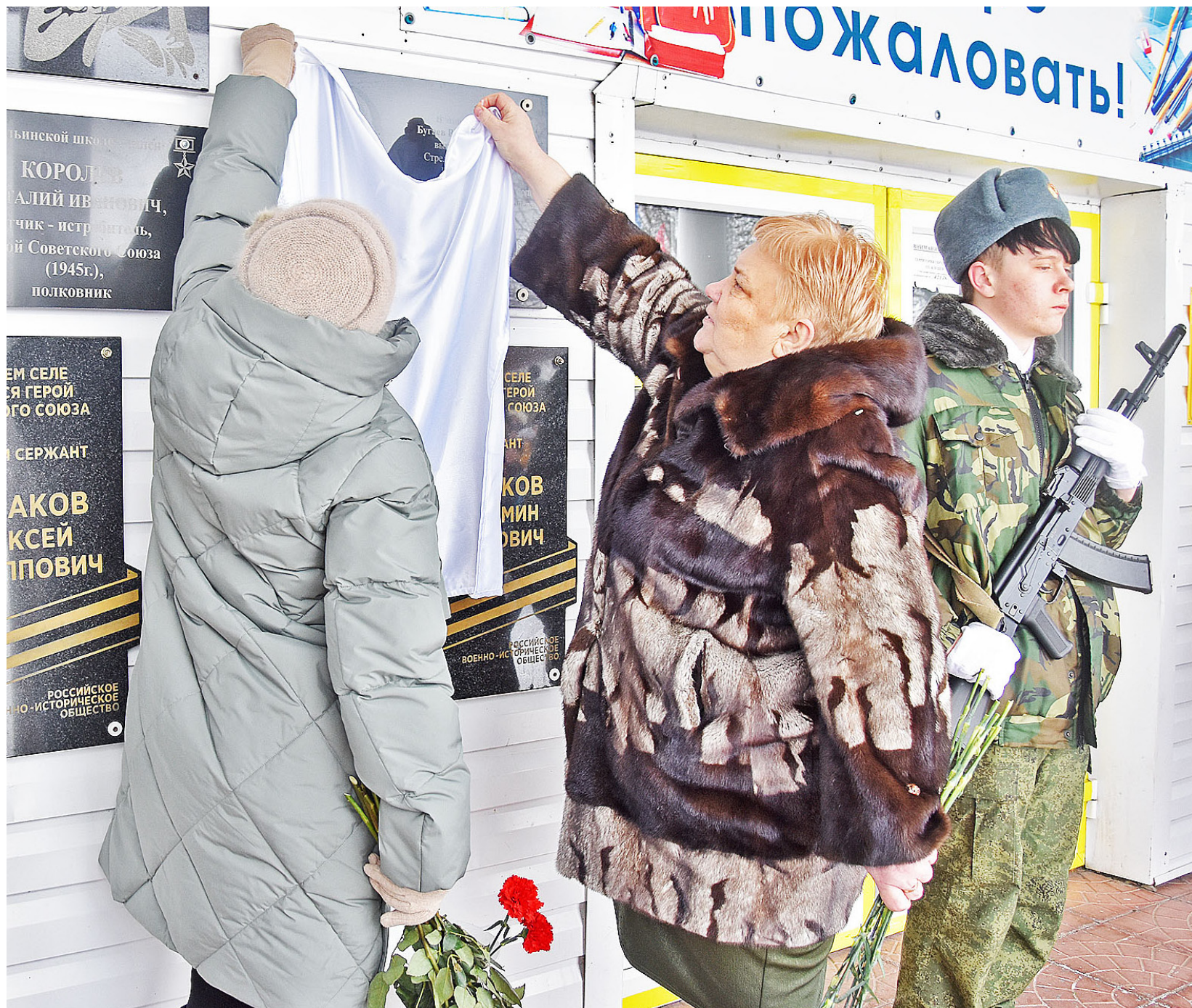
Мемориальная доска на здании Ильинской школы будет напоминать о том, что здесь учился герой-земляк Владимир Бугаев