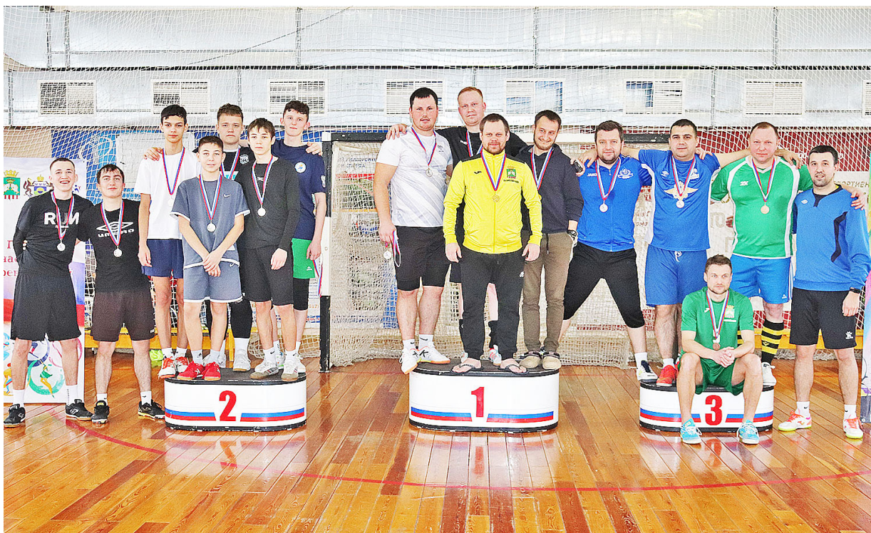
Цель футбольного турнира – встретиться, пообщаться, показать хороший пример молодёжи

Первого февраля на снежную трассу вышли лыжники, на деревянный паркет – футболисты, а на ледовом корте сыграли хоккеисты