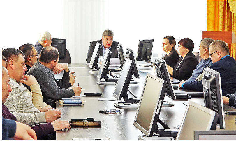
Подготовка к весеннему сезону полевых работ – главная тема совещания

Аграрии Казанского района готовятся к весенним полевым работам