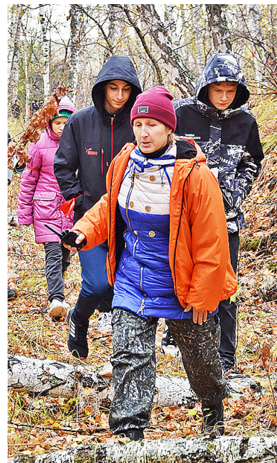
Обнаружить клеща легче на светлой одежде

Наиболее эффективным методом профилактики клещевого энцефалита является вакцинация. Вакцинироваться можно по ускоренной схеме, состоящей из 2-х прививок. Через год после завершения вакцинации для поддержания сформированного иммунитета необ-