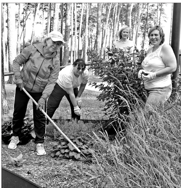
📷 Заводоуковцы отлично потрудились на субботнике во благо любимого города.

На следующий день работы продолжились на улице Заводской и в других частях города. Вот так общими усилиями земляки сделали наш город чище, а значит, ещё красивее!