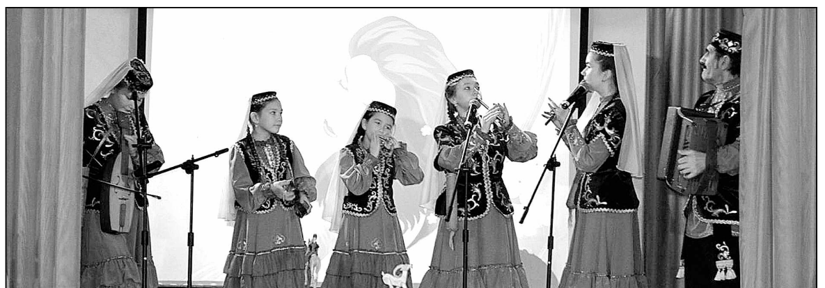
Выступает фольклорно-этнографический ансамбль «Шытыр-шатыр» под руководством Гаязы Габдуллина.

Инна ГОРБУНОВА.