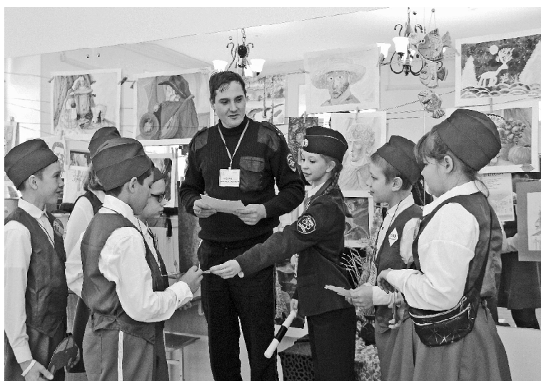
➤ На районном слёте ЮИД в Викулово