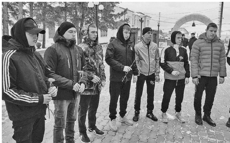
➤ У Мемориала Славы