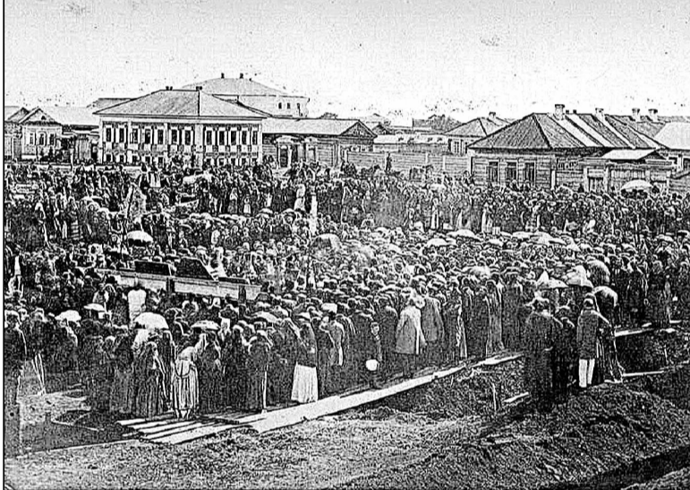
Закладка Александровского реального училища

Ольга БОРОВИКОВА.