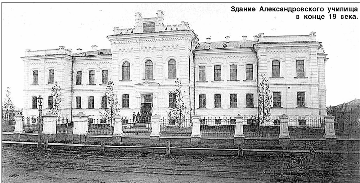
Здание Александровского училища в конце 19 века.

Чтобы начать строительство, необходимо было найти и расчистить место — на это тоже нужны были деньги. После долгих консультаций был выбран участок в квартале, застроенном частными домами, на самом краю Александровской площади — главной площади города в то время. И избранный на тот момент городским головой Подаруев пообещал, что к постройке