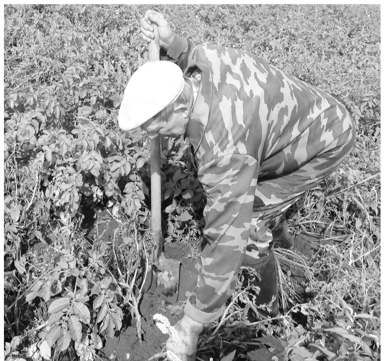
Картошечку скоро копать.

Ко Дню матери тоже участвовал в концерте.