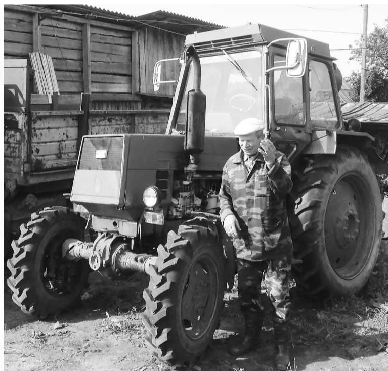
На подворье Луниных.