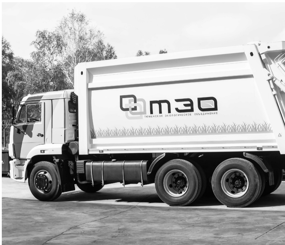
Такие мусоровозы будут увозить коммунальные отходы с территорий нашего района.

Новая услуга будет относиться к коммунальной, поэтому все льготы (для ветеранов, инвалидов, многодетных семей и т.д.) сохраняются.