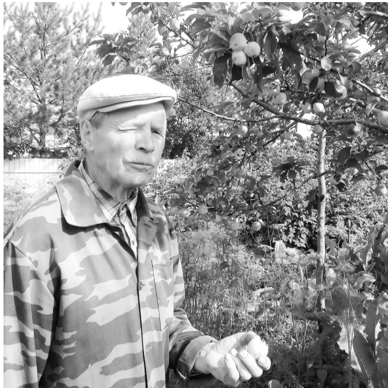
Кисловатые ещё яблочки.

В День пожилых людей, 1 октября, по просьбе завклубом Берёзовки, наряду с артистами ЦКиД и местными играл на гармошке, пел частушки – зрители тепло приветствовали.