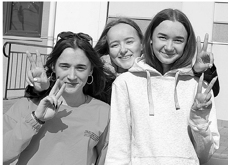
«Прививаться или нет?» - актуальный вопрос

способствовать уменьшению роста числа заболевших. Также 75 % опрошенных сомневаются в быстром окончании пандемии, ведь помимо домашнего общения люди гуляют, ходят в магазины и школы, где постоянно контактируют. Они предполагают, ношение масок и пользование антисептиком не поможет предотвратить