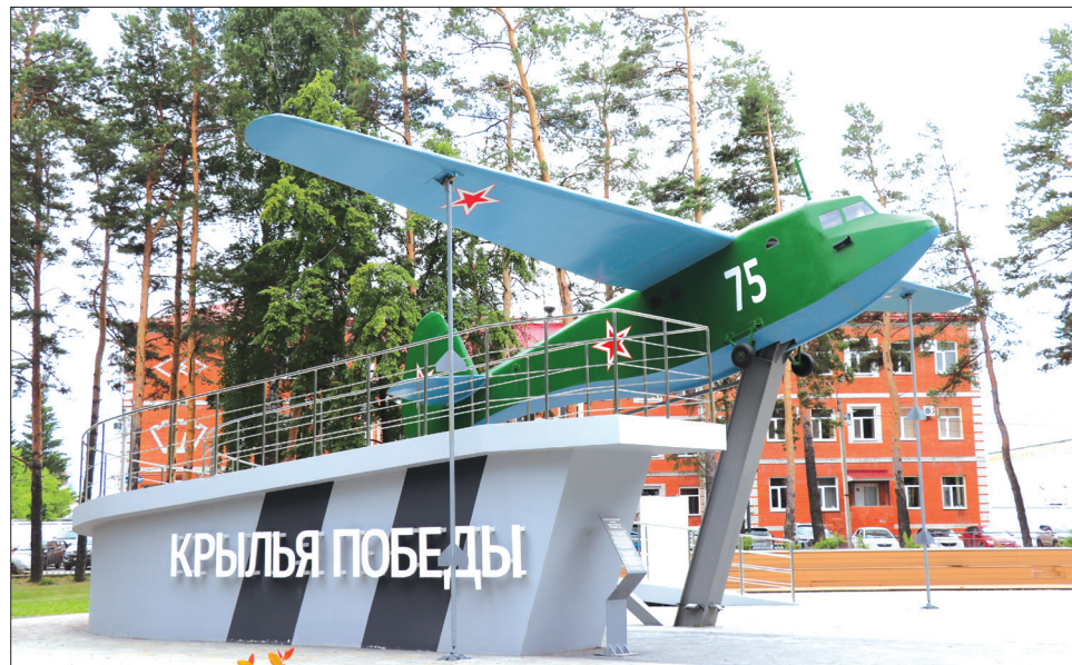
■ Полноразмерный макет планёра А-7, установленный в парке машиностроителей чуть больше года назад, уже стал одним из символов Заводоуковска.