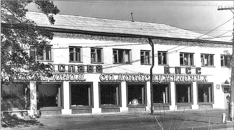
📷 Шесть десятилетий назад в этом здании на улице Шоссейной, 146 располагалась контора Заводоуковского горторга и магазин самообслуживания. Сейчас здесь торговые точки и офисы разных фирм.

Долгое время отделения Заводоуковской центральной районной больницы были разбросаны по всему городу. С начала 1980-х медицинские службы решили сосредоточить на улице Хахина. В 1985-м в строй ввели поликлинику, затем терапевтическое отделение, лечебный и административный корпуса. В 1983 году было основано крупное предприятие – Южные