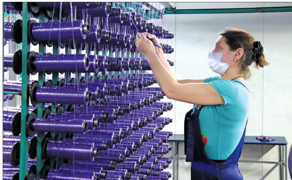
■ Заводоуковский завод по производству овощной сетки «АРАНЕО» выпускает продукцию по собственной уникальной технологии из отечественного вторичного и первичного сырьё.