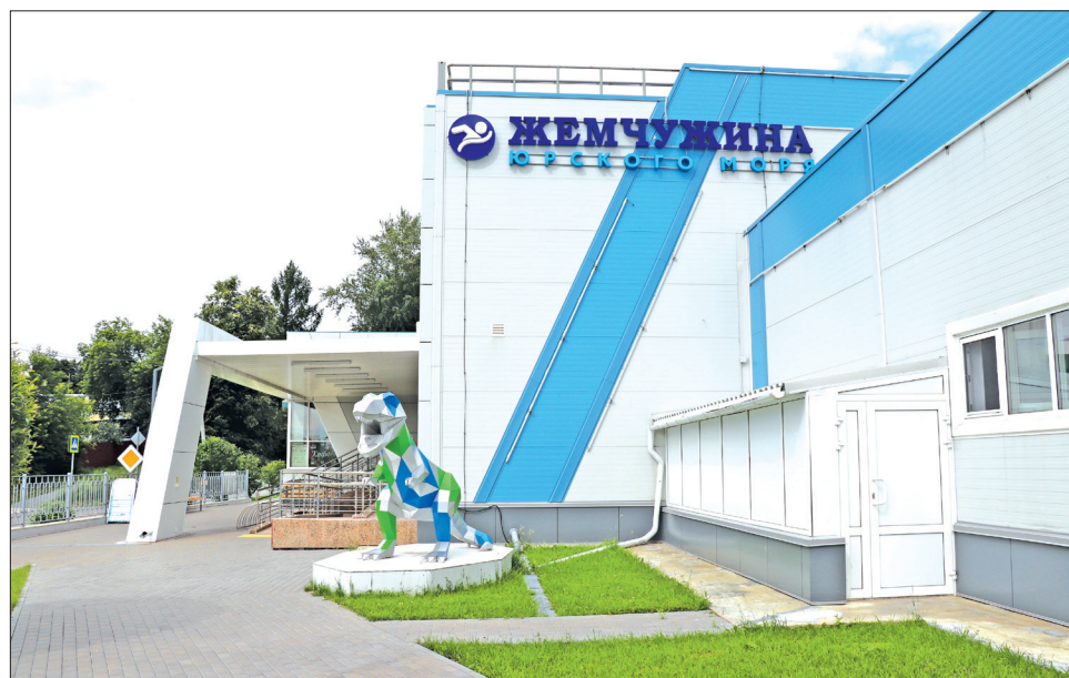
■ Плавательный бассейн появился в Заводоуковске благодаря победе в рейтинговом голосовании по выбору объектов строительства в рамках федерального проекта «Формирование комфортной городской среды».