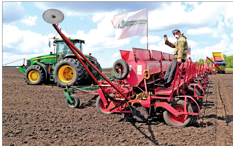
■ В этом году Заводоуковский муниципальный округ первым в Тюменской области завершил посевную кампанию.

На территории муниципального округа можно насладиться красотой природы и активно провести время, к примеру, на базах отдыха или совершить прогулки на лошадях и обучиться верховой езде в конном клубе.