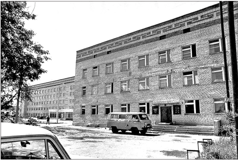
📷 Поликлиника, построенная в 1985 году на улице Хахина, – одно из первых зданий комплекса областной больницы № 12.

электросети энергетического управления «Тюменьэнерго» (ныне филиал «Россети Тюмень») – Южное территориальное производственное отделение). В 1984 году на улице Свободы перезахоронили разведчиков 253-го стрелкового полка «Красные орлы», погибших в