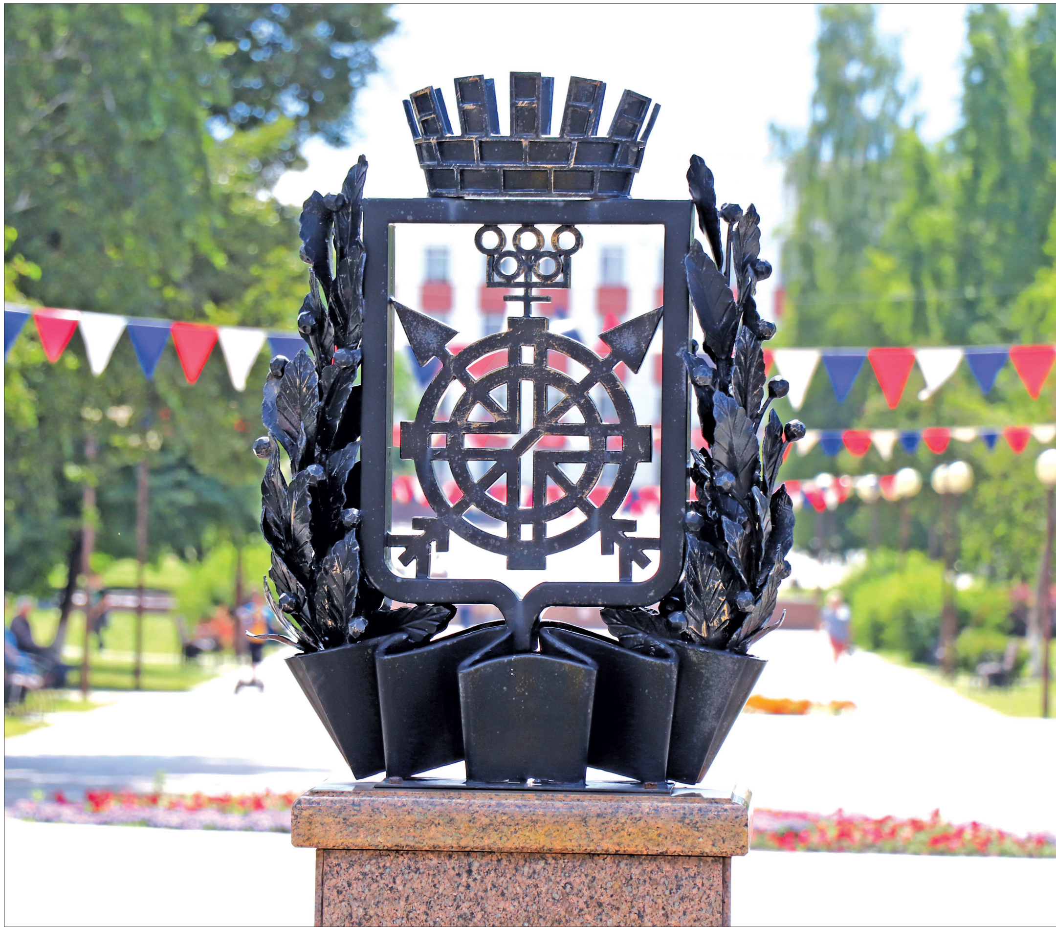
■ Заводоуковск – самый молодой город на юге Тюменской области. Он получил этот статус в 1960 году.

В городском микрорайоне Южном сформирован 1 031 участок. Получили градостроительные планы и приступили к строительству собственных