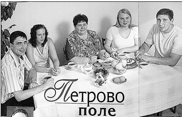
Ташкеевы в АПК 159 лет.