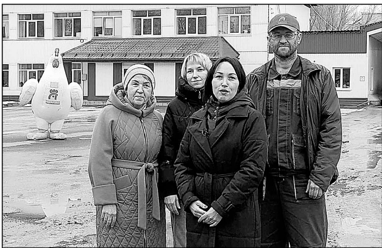
Володины-Шадрины-Байгиреевы работают на «Пышминской».

На предприятиях АПК в Тюменском районе трудятся целыми поколениями.