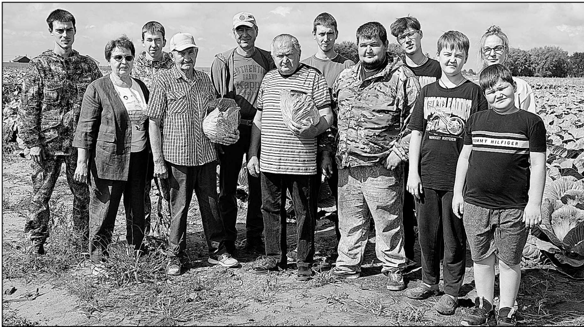
У династии Кичиковых в сельском хозяйстве – большой стаж.