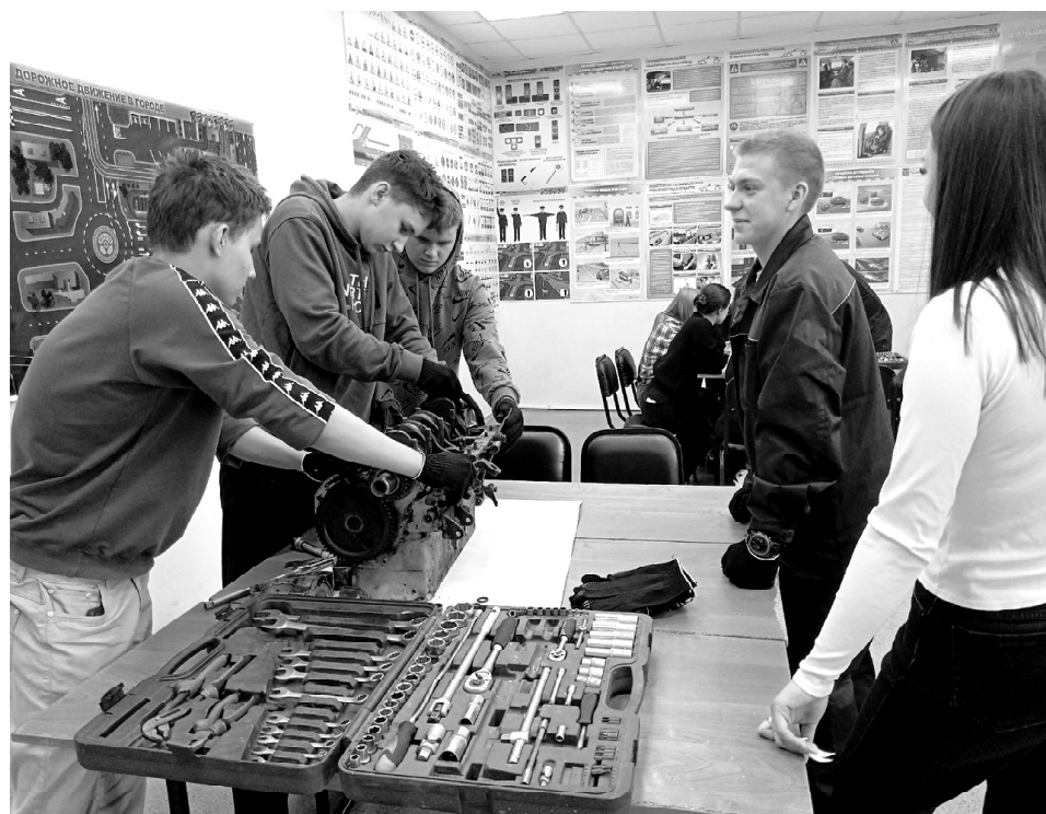
➤ На Дне открытых дверей в техникуме

На станции «Экспертиза» их ждало проведение опытов. Здесь научились определять качество продуктов. Например, увидели, как проявляют свойства опущенные в воду куриные яйца. Испорченное яйцо в воде всплывает, потому что газы от разложения делают его менее плотным, чем вода. Свежие яйца, напротив, тонут. Посетив станцию «Мастера», ребята на некоторое время погрузились в профессии «Тракторист-машинист сельскохозяйственного