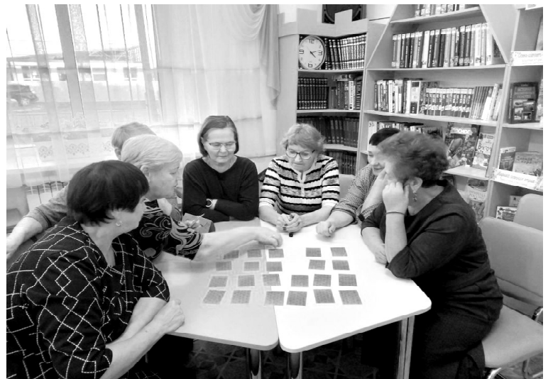
➤ Квиз-игра в библиотеке