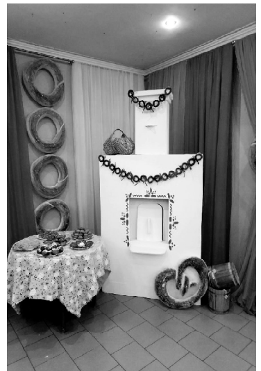
➤ Печка русская, РДК

Особое внимание привлекла яркая фотозона с блюдами народной кухни — эчпочмаком,