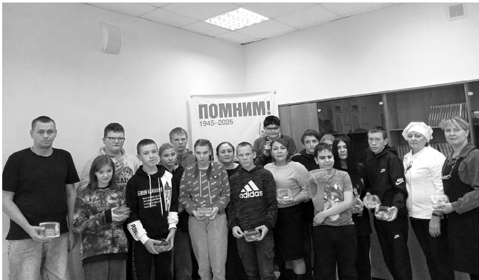
➤ На встрече в техникуме

День народного единства — это праздник, символизирующий силу и сплочённость российского народа. 31 октября в Викуловском отделении Ишимского многопрофильного техникума состоялось мероприятие «Народов много — Родина одна». Оно прошло в преддверии праздничной даты.