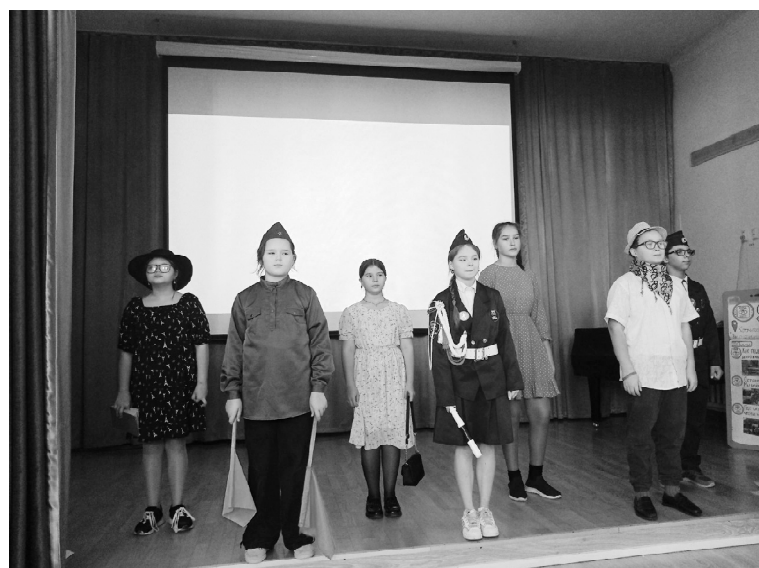
➤ Команда Викуловской школы №1

Победителями слёта стали отряды ЮИД: первое место – отделение Коточиговской школы, второе – отделение Нововяткинской школы, третье место – Викуловская школа №2. Начиная с 2023 года, стало традицией вручать Переходящий Кубок образцовому отряду, кото-