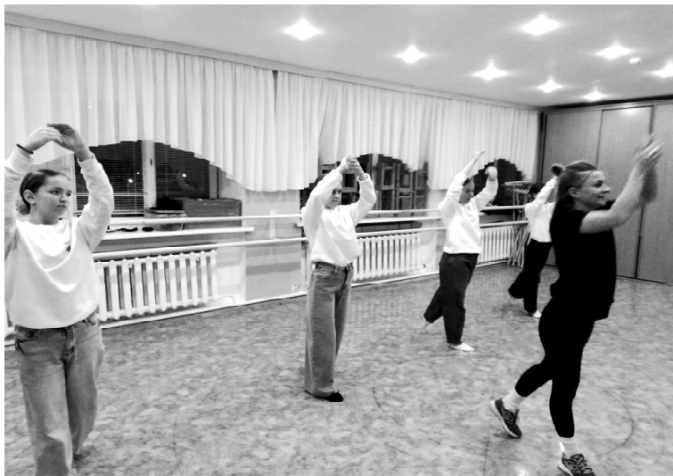
➤ «Танцевальный петачок»

мероприятии, о красоте русской культуры.