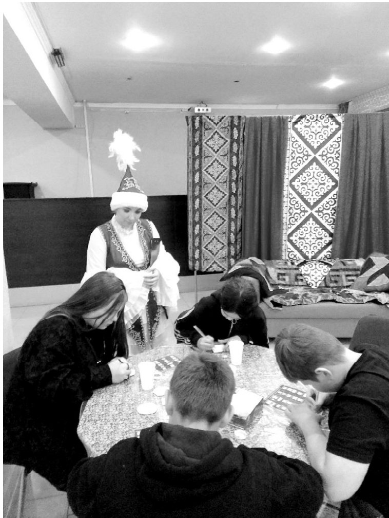
➤ На мастер-классе по созданию казахского оберега в РДК

креатива» участники акции сделали топперы в цветах российского триколора, куклу «Народницу» и яркие брелоки из фетра «Русская матрёшка». Все эти поделки останутся на память о