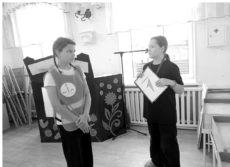
➤ На станции «Требование дорожных знаков»