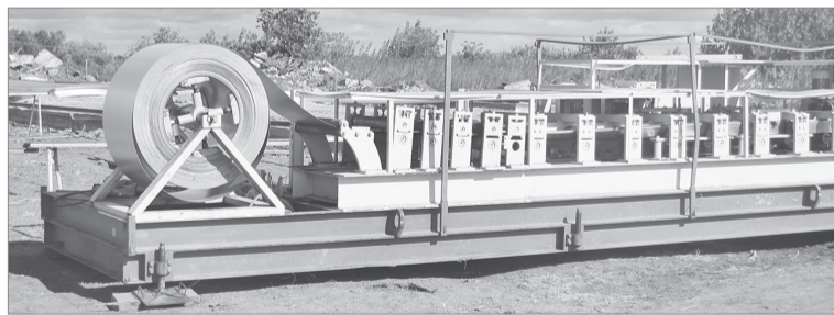
Оборудование для гибки железа на строительной площадке ООО «СеверСтрой»

«СеверСтрой» начал монтаж арочника, металлоконструкции для которого изготавливают на собственном оборудовании, предназначенном для гибки железа.