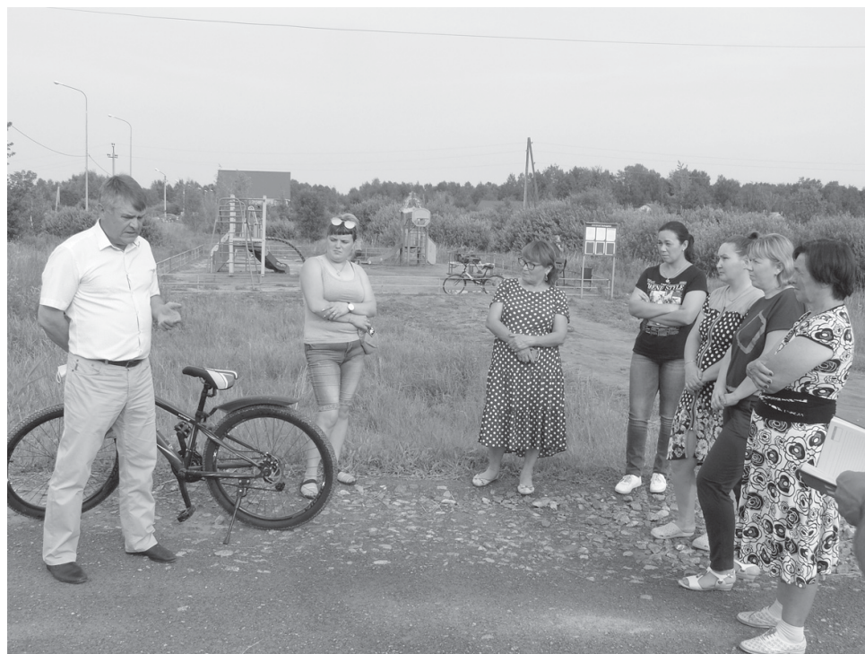
У всех участников встречи была возможность задать вопросы главе района

Газификация жилого фонда стала не единственным вопросом, который обсудили в этот день участники встречи. Еще одна давняя проблема Молодёжного — обеспечение водой. Этот вопрос, по словам