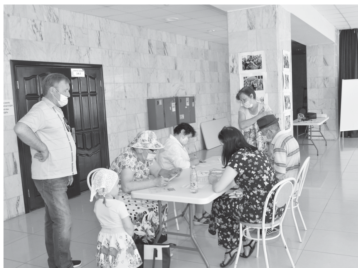
Первым делом – подписание согласия на прививку

Также все привившиеся в этот день в ЦКД могли поучаствовать в розыгрыше призов, проводившемся на площадке перед зданием Центра. Напомним, среди вакцинированных разыграли сорок бесплатных месячных абонементов на посещение спорткомплекса «Ярково» в июле 2021 года и возможность бесплатного прохож-