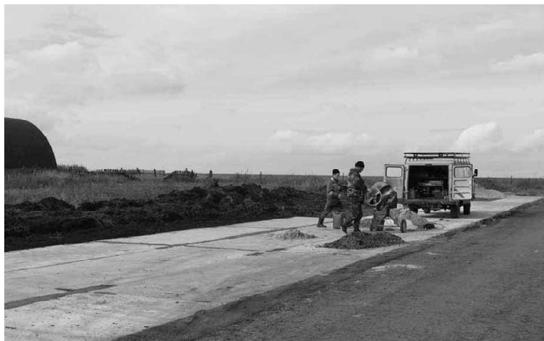
Строительством специальной площадки для сбора крупногабаритных отходов занимаются работники ООО «Ромист»

В Омутинском районе финансовую помощь от государства по программе «Содействие самозанятости безработных граждан» получили в 2021 году два человека; в 2022 - один человек.