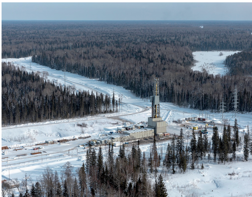
Предприятие активно наращивает ресурсную базу.