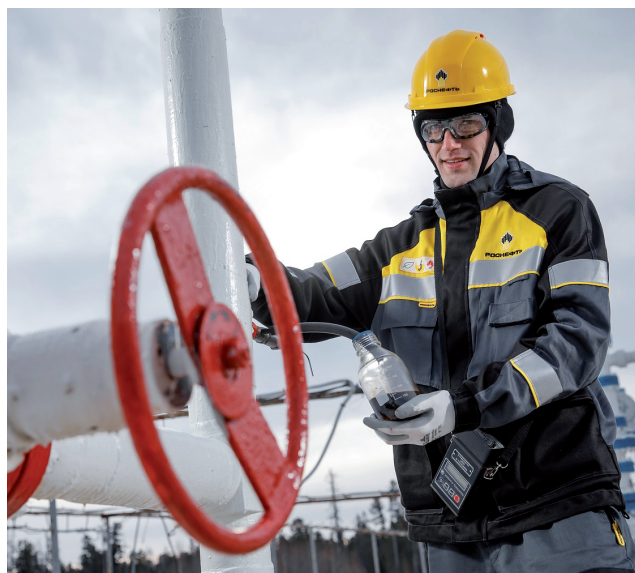
Реализацию Уватского проекта сегодня обеспечивают более 2,7 тысяч сотрудников.

Для повышения эффективности производства предприятие активно внедряет инновационные разработки «Роснефти», такие, как информационно-технологическая система «Сфера 3D», которая содержит более 3-х тысяч цифровых двойников объектов и более 5,7 тыс.