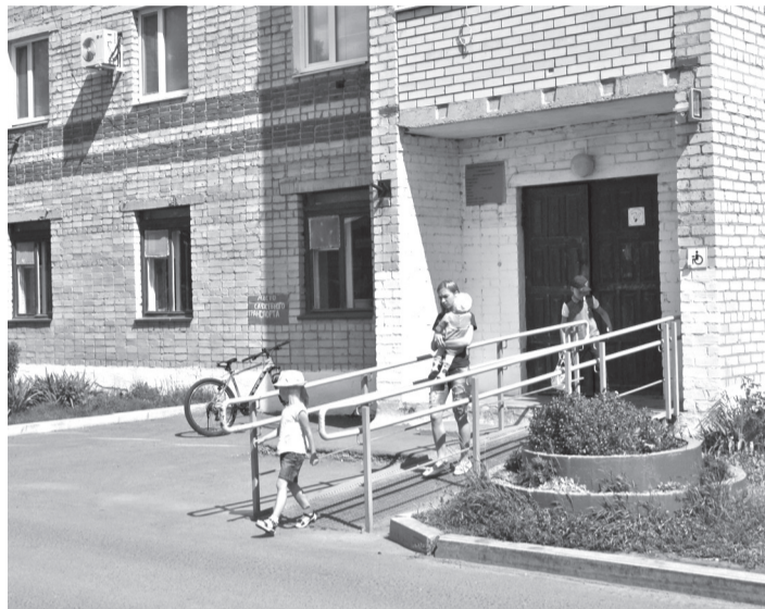
• После того, как отремонтируют детское и инфекционное отделения областной больницы № 12, начнётся реконструкция детской поликлиники. Её площадь значительно расширится за счёт стоматологии (планируется, что стоматологическое отделение разместится в новом здании, которое построят на территории центральной больницы).