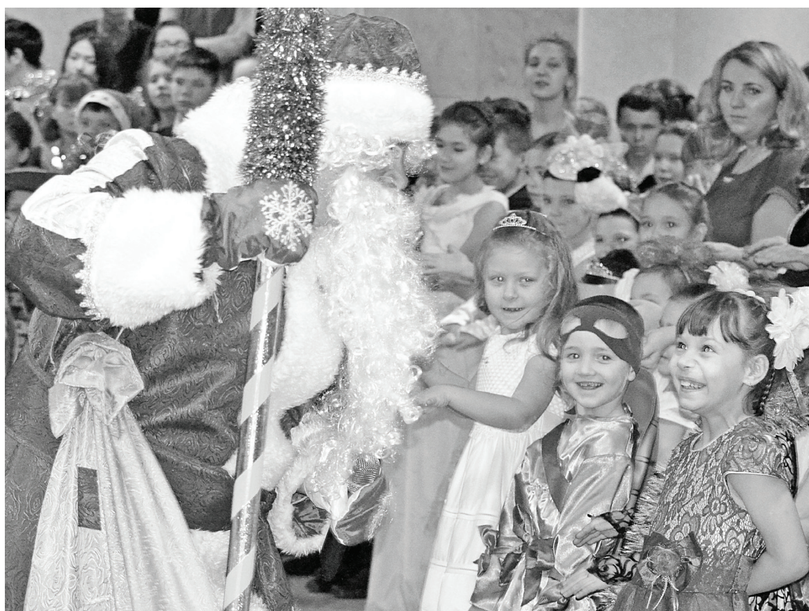
Весёлые игры с добрым волшебником Дедом Морозом — что может быть чудеснее под Новый год?

Глава района поздравил всех с успешным завершением всех планов 2015 года, пожелал ещё лучших результатов в наступающем 2016-м и вручил награды победителям районного конкурса на лучшее праздничное оформление «Новогоднее настроение».