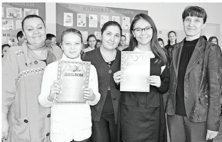
Бухтальские умницы со своими учителями-наставниками.