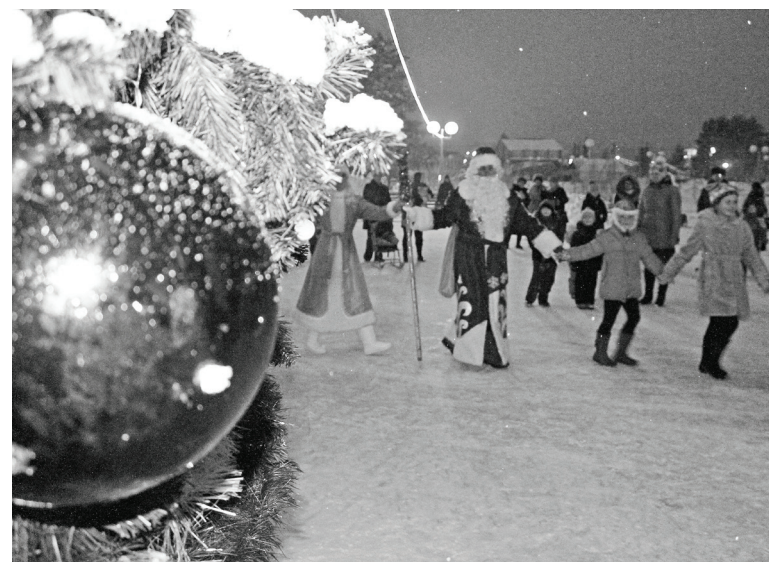
Весёлый хоровод вокруг лесной красавицы на открытии районной ёлки.