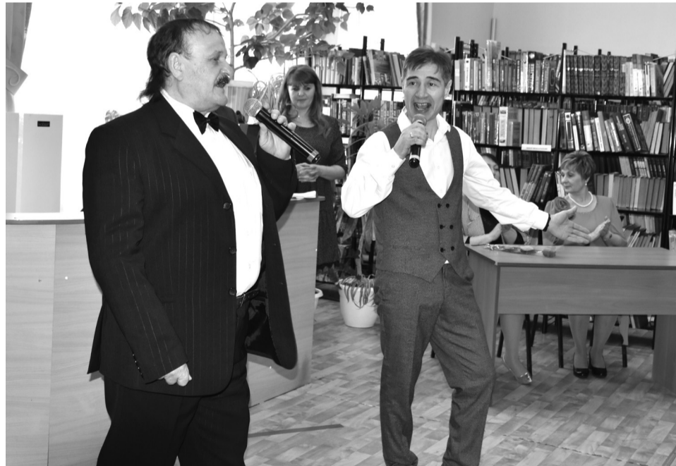
На снимках: фрагменты церемонии награждения