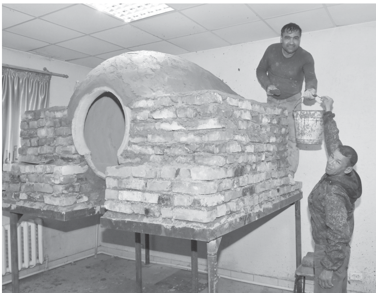
Последние приготовления перед запуском новой печи в работу

Специальные печи заказывали в одном из среднеазиатских государств. Два больших «сосуда» и два поменьше изготовлены из особой глины с добавлением овечьей шерсти. Именно поэтому тандыры быстро нагреваются, хорошо держат тепло, и жар в них распределяется равномерно. Тесто «наклеивается» на стенки таких «кувшинов» и запекается. Конечно же, для работы с подобной печью требуются определенные умения и навыки. К примеру, тесто по всей внутренней поверхности печи раскладывается специальными лопатками. Нагревается тандыр за счет обычных древесных углей, причем эта печь очень экономична.