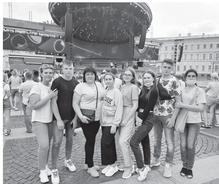
Знай наших, город на Неве!

«Алые паруса» в Санкт-Петербурге – красочный праздник выпускников, кульминацией которого является проход брига «Россия» под алыми парусами. По традиции, путь во взрослую жизнь для выпускников учебных заведений северной столицы начинается с берегов Невы, где под праздничный салют бриг уносит детство вчерашних школьников. Стать свидетелями этого незабываемого события, полюбоваться архитектурными красотами Санкт-Петербурга ежегодно собирается до полумиллиона человек: на праздник приезжают как взрослые, так и дети из других российских регионов и стран.