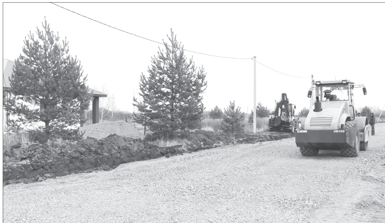
Одна из ремонтируемых улиц - проезд № 3