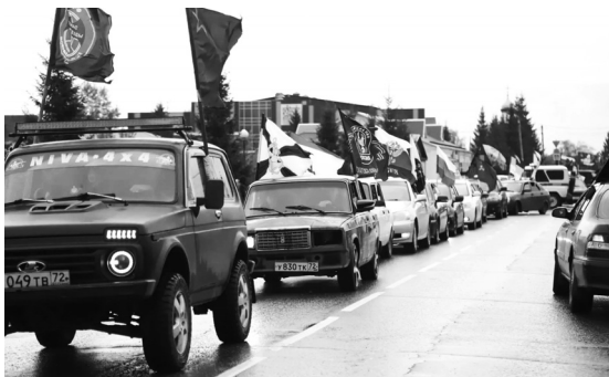
По улицам посёлка Голышманово проехали около сотни автомобилей в колонне Бессмертного автополка

Активисты «Движения первых» вместе с родителями и наставниками приняли участие в патриотической акции «Рассвет Победы». Они пришли к мемориалу воинам, павшим в годы Великой Отечественной войны, ранним утром 9 Мая. Также голышмановцы присоединились к масштабной музыкальной акции «Страна поёт Катюшу». Завершилось празднование 9 Мая акцией «Свеча Победы».