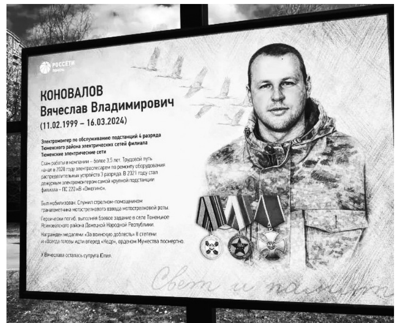
Экспозиция с фотовыставки «Свет и память» в городе Сургуте