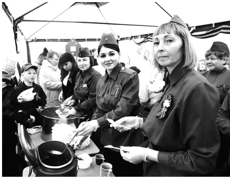
Почти на 10 площадках волонтеры сварили больше 3000 порций традиционной солдатской каши, чтобы каждый мог почувствовать вкус Победы

– Я заметила, что с каждым годом празднование Дня Победы становится всё значимее для людей. Наверное, стали понимать, что такое защищать свою землю и каково было фронтовикам. Специальная военная операция в наши дни не проходит бесследно для многих семей, поэтому понять значимость Победы в 1945 году необходимо сейчас подрастающему