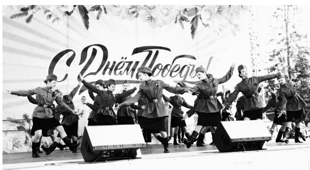
Под военные песни голышмановцы обменивались воспоминаниями о своих героически ушедших родственниках