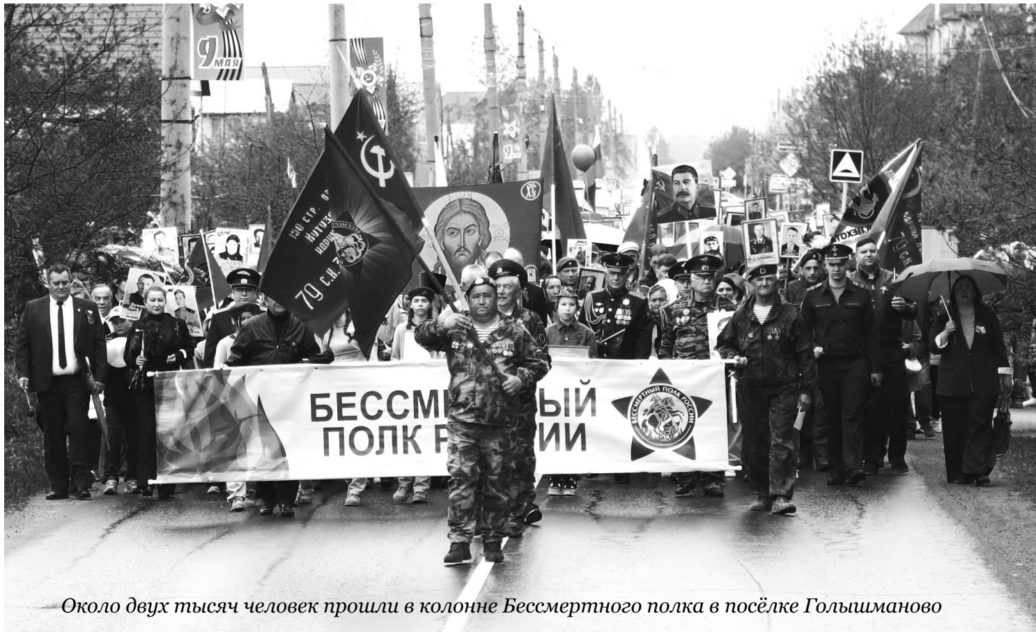
Около двух тысяч человек прошли в колонне Бессмертного полка в посёлке Голышманово