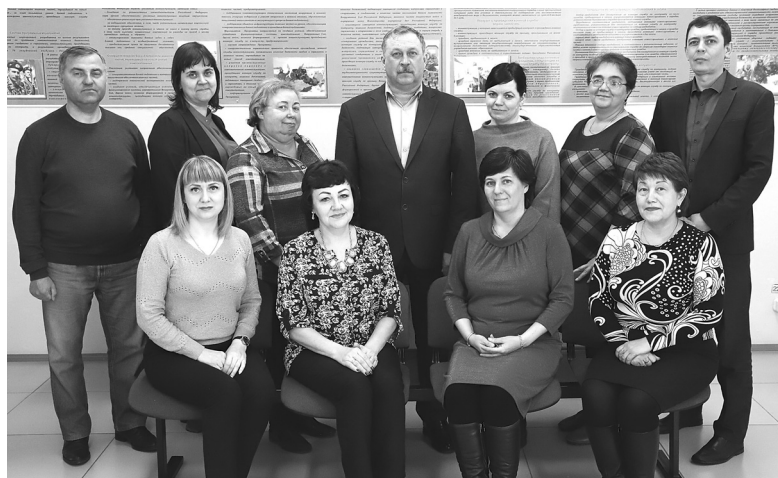
Современный военный комиссариат объединяет три муниципалитета – Голышмановский округ, Аромашевский и Бердюжский районы. В его штате около 20 сотрудников

На улице Ленина, 5, в посёлке Голышманово военкомат располагал-