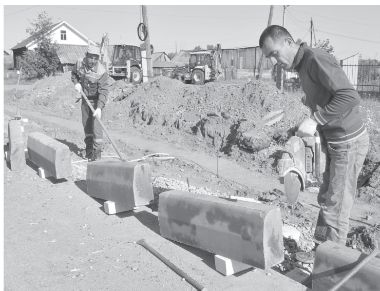
На улице Республики появится долгожданный тротуар