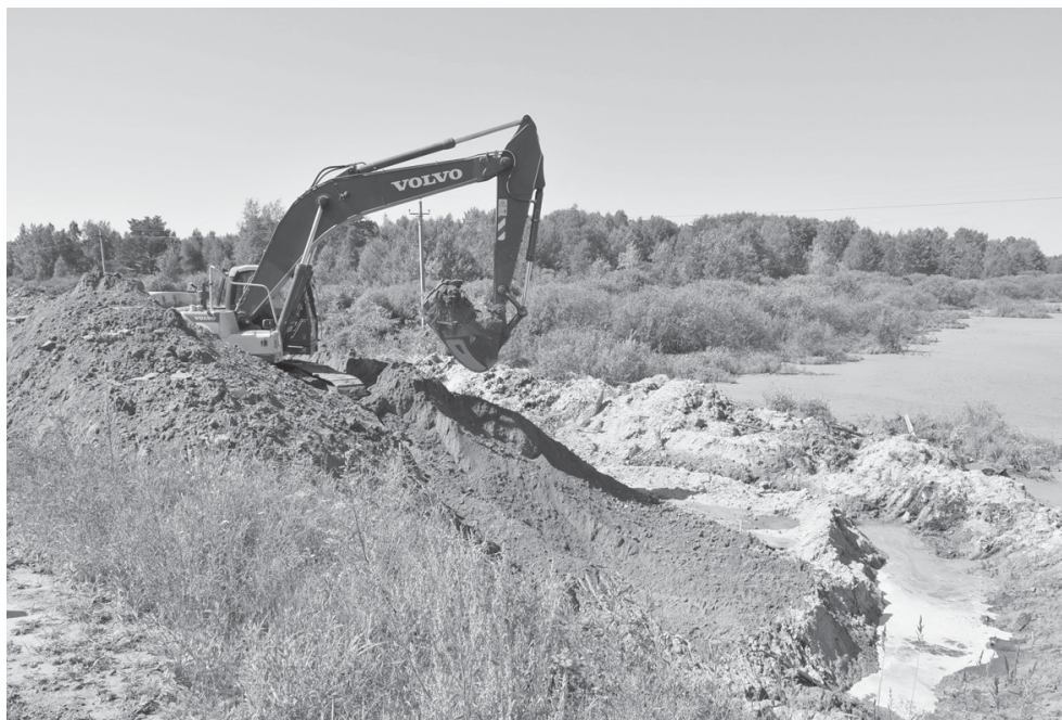
Работы на самом трудном участке – возле озера Светлого

Решен и еще один вопрос – с вырубкой деревьев для расширения дороги в основном бору около Ярково. Для этих целей дорожники получили специальный лесобилет. Совсем скоро начнется монтаж надземного пешеходного перехода через дорогу вблизи поселка Молодежный. Он будет немного выше аналогичных сооружений, которые можно видеть на въезде в Тюмень, – шесть метров над уровнем дороги. Де-