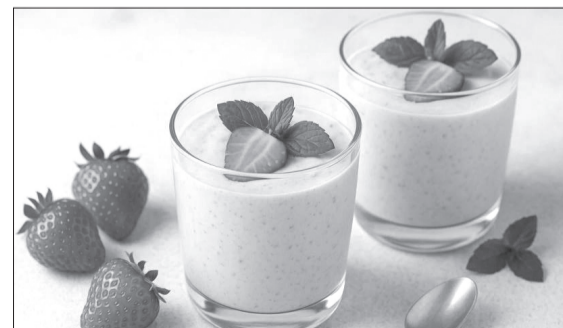
Страницу подготовила Анна МИСЛЕР . Использованы материалы официального портала Минздрава России takzdorovo.ru

Кстати, при отсутствии ягод напиток можно приготовить и из двух ингредиентов - фантазии тут нет предела. Зефир можно взять обычный ванильный или с каким-либо вкусом. Да и с пропорциями поиграть не запрещается, ведь кому-то хочется послаще, другим - наоборот. К тому же и кефир бывает разной кислотности, и зефир - разной сладости. В любом случае в результате вы получите полноценный коктейль-десерт, напоминающий подтаявшее мороженое.