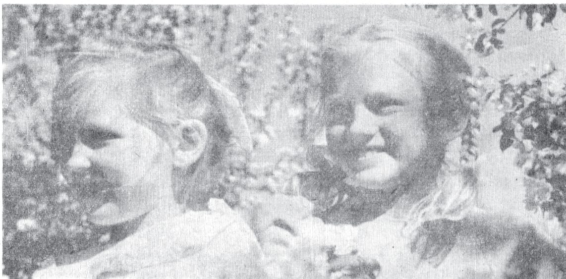
Ласкают девчонок цветущие ветви яблонь. Светит им доброе солнце. Мирное небо опрокинуло над ними чистую синь. Растут они

Хочу я слышать Звонкий смех, Хочу я радости Для всех. Со всеми вместе Я хочу За правду встать Плечом к плечу. Хочу я руки протянуть Всем, кто вступил На правый путь. На путь борьбы За то, чтоб зло Из жизни Навсегда ушло. Хочу любить, Хочу дружить. Чтоб злая бомба