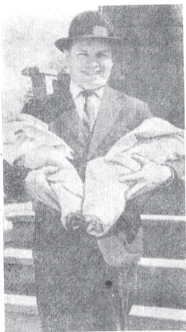
Не каждому папаше улыбается такое счастье, когда жена дарит ему сразу двух дочерей.

Дети живут на нашей планете, Самые лучшие дети на свете! Самые сильные, самые смелые И загорелые. Солнце кладут они на плечо — Не горячо! Море, где гул и пена, — Им по колено. Нравится детям наша планета: Много воды, воздуха, света. Нужно им только, чтоб атом военный Стал бы машиной обыкновенной!