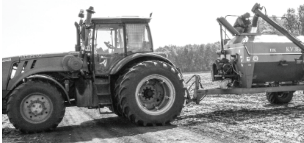
Идёт заправка посевного комплекса семенами и минеральными удобрениями.

Все участники сева – незаменимые работники. Хочется отметить, что у нас только профессионалы: добросовестные, трудолюбивые,