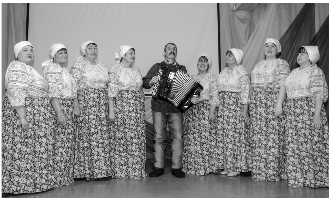
Артисты на сцене родного Дома культуры.

Лопазновский вокальный коллектив победил в региональном фестивале-конкурсе.