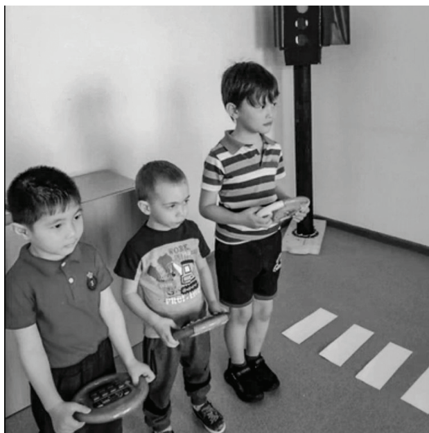
Кадр из конкурсного видеоролика.

В Доме детского творчества «Галактика» подведены итоги конкурса на лучший видеоролик «Дорога без опасности» среди дошкольных образовательных учреждений Сладковского муниципального района.