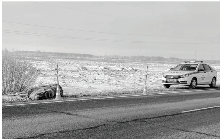
ДТП с диким животным.

Дикие животные – олени, косули, кабаны, лисицы – представляют немалую опасность для автомобилистов. Нередко фиксируются случаи дорожно-транспортных происшествий с их участием. Госавтоинспекторы призывают граждан, управляющих техникой, быть внимательными и осторожными.