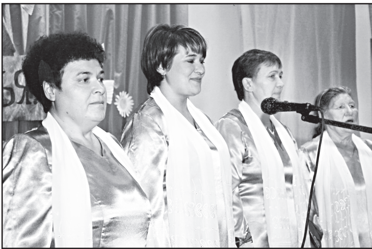
С вокальным коллективом