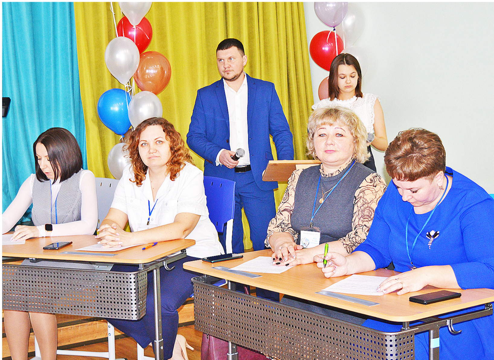
Задача участников конкурса – доказать свою компетентность и профессионализм

Состоялся районный этап конкурса профессионального мастерства «Педагог года – 2022»