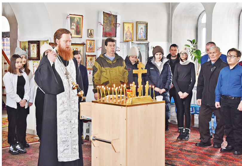
На службе в храме вспомнили поимённо погибших десантников 6 роты

закладки этого монумента и неоднократно приезжал в регион, чтобы почтить память героев. А в 2017 году в Чечне вблизи от 776 высоты был установлен Поклонный крест. На малой родине бойцов, погибших при исполнении боевого задания, воздвигнуты памятники и бю-