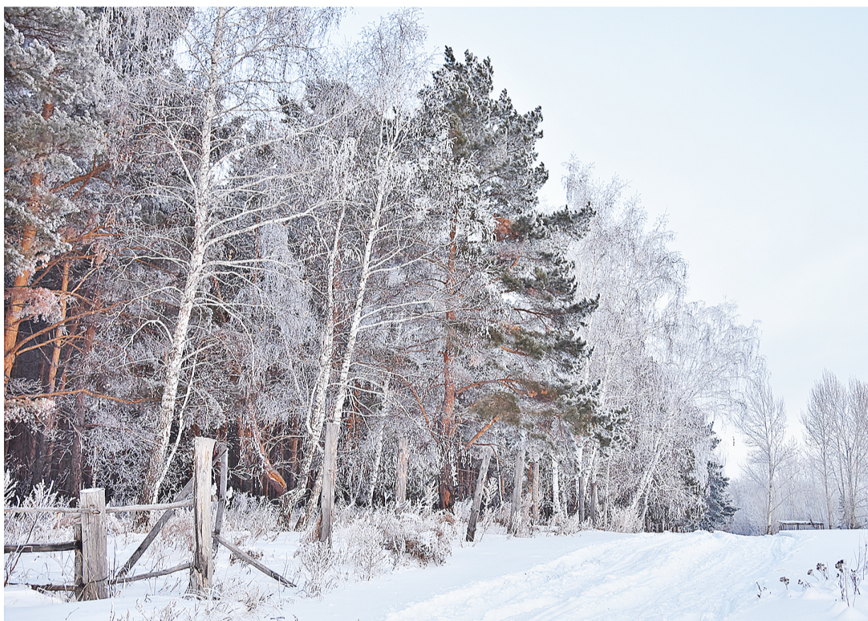
ЛЮБИМЫЙ КРАЙ ЗЕМЛИ КАЗАНСКОЙ