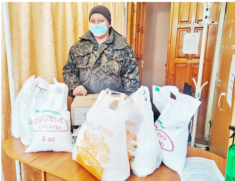
Продукты питания для эвакуированных соотечественников из Донбасса

Все, кто желает помочь гражданам ДНР и ЛНР, могут принести вещи по адресу: с. Казанское, ул. Ленина, 10 (здание управления социальной защиты населения) с 9 до 16 часов. Или в другой пункт, который находится на базе Казанского центра развития детей. Вещи и продукты питания принимаются с 8 до 17 часов. Задать интересующие вопросы можно по телефонам штаба 8 (34553) 4-12-03, 8-982-787-94-64 (Суплотова Мария).