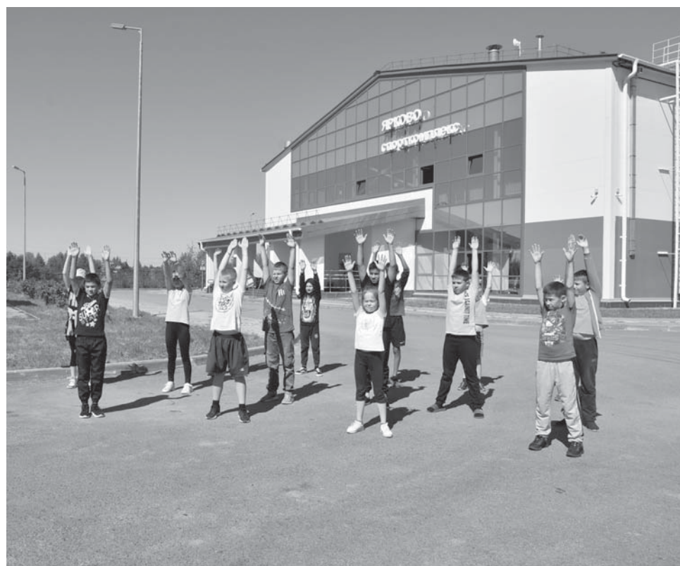
В течение всего нынешнего лета на базе спорткомплекса «Ярково» работает лагерь для детей

- В прошлом году на стадионе в райцентре были установлены современные трибуны. Следующий этап работ здесь – возведение ограждения, которое необхо-