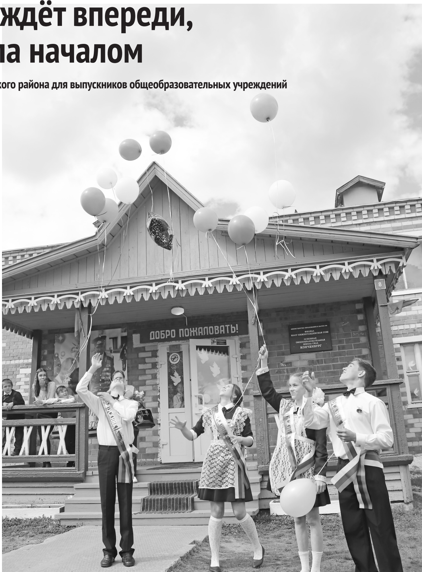
Выпускники Конченбургской школы по традиции загадали желания и отпустили в ясное небо шары – пусть летят, и пусть исполнятся все их мечты!