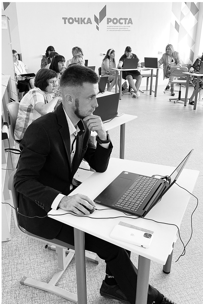
Работа методических секций прошла в «Точке роста» в Окуневской средней школе

«1» В школах района реализуется программа по патриотическому воспитанию, в рамках которой на протяжении нескольких лет функционируют классы добровольной подготовки граждан к военной службе. Большой вклад в формирование патриотических ценностей учащихся вносят поисковая, а также архивно-музейная деятельность, осуществляется пополнение фондов школьных музеев и комнат Боевой Славы. Особое внимание уделяется государственным символам России, Тюменской области, Бердюжского района. Проводятся мероприятия в День Конституции России, День России, День согласия и примирения. Торжественно проходит акция «Мы – граждане России», Вахта Памяти 9 Мая.