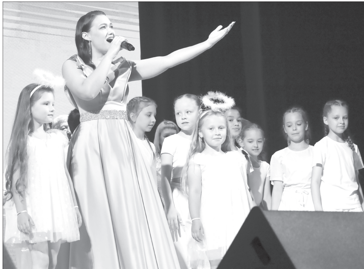
На сцене звучали песни, посвящённые Ялуторовску, его истории и людям